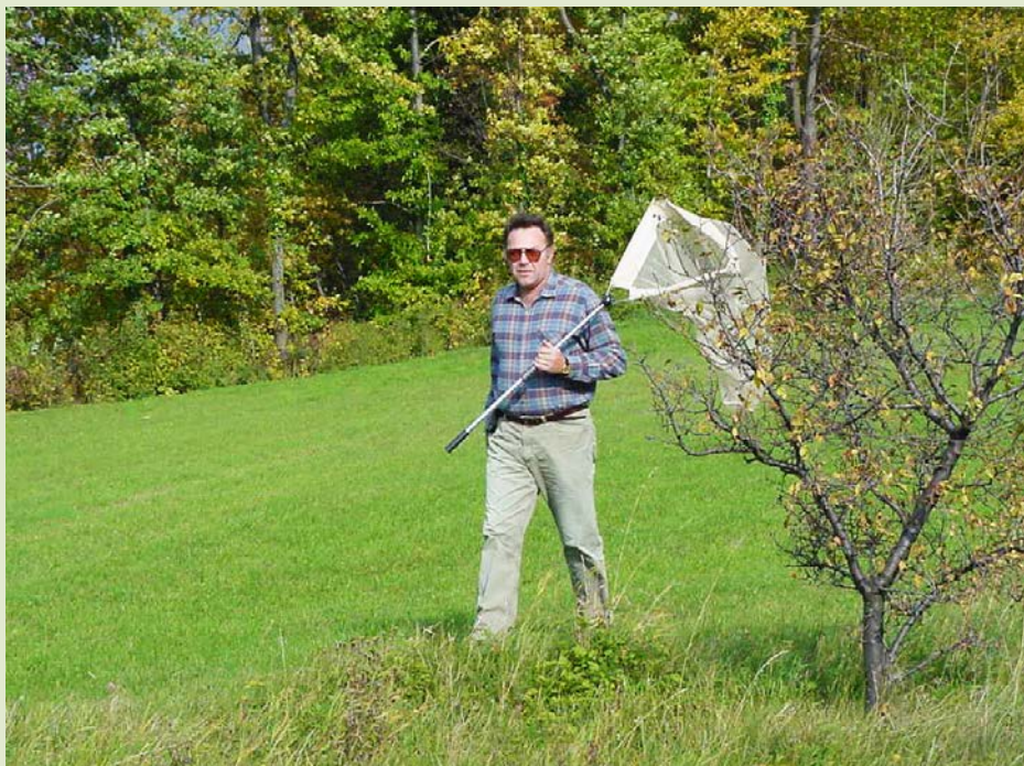
Na terenu pri Teharjah.

Z metulji sem se začel ukvarjati že v osnovni šoli. Otroke veliko stvari zanima in sam nisem bil izjema. Imel sem srečo, da sem odraščal ob dveh sosedih, ki sta imela zelo rada naravo. Prvi je bil ribič in me je velikokrat peljal na ribolov k Savinji. Drugi, ki je bil aranžer, pa je imel udomačeno šojo, ki je »govorila«. Oponašala je škripanje kovinskega vedra, imena ljudi ipd. Ta gospod je imel v škatlah tudi nekaj metuljev, ki jih je zbiral. V poletnem somraku smo s sovrstniki večkrat šli do Savinje, poiskali rastišča milnice in lovili slakove veščece za tega gospoda. Takrat sem se spoznal z metulji in tudi sam ujel kakšnega admirala in lastovičarja. Spo-