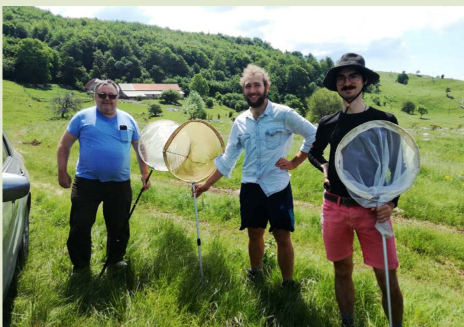
Del ekipe Tardigradi na MetuLovem dnevu, ki ga organizira DPOMS.

menim, da je bazična biologija in s tem taksonomija pomembna tudi v varstvu narave. Pod tem vplivom sem se zaposlil na Centru za kartografijo favne in flore, kjer sem bil zaposlen od leta 2000 do 2020, ko sem se upokojil.