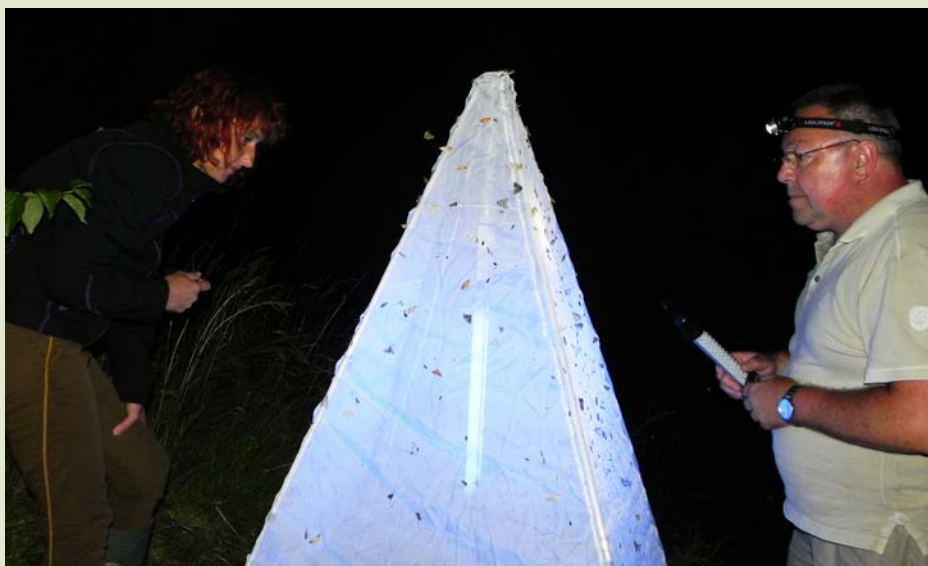
Med nočnim terenom v sklopu Evropskih noči nočnih metuljev v Rifengozdu pri Celju.