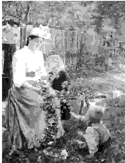
Poletje (olje, 1889-90)

Ivana Kobilca (1861-1926) je bila prva akademsko izobražena slovenska slikarka. Uvrčena se med klasične slovenskega realizma, ki so s svojo veličino utirali pot modernemu slovenskemu slikarstvu. Že s svojo prvo razstavo v domači Ljubljani leta 1889 je vzbudila vsesplošno pozornost. Njen uspeh je bil ne toliko bolj presenetljiv, saj se je uveljavila na področju, ki je dotlej pripadalo moškim.