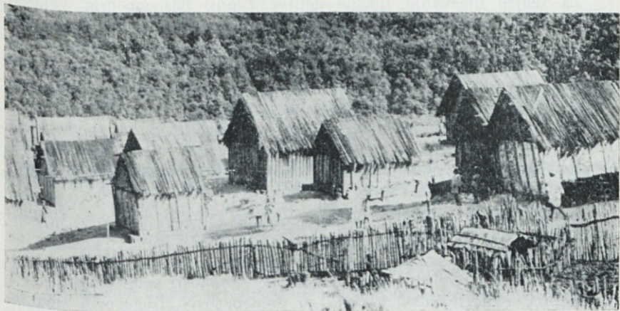
Tipična malgaška vas.

Dela je veliko, le poguma nam ne sme zmanjkati. Čeprav ni pričakovati ne vem kakšnih zunanjih uspehov, bo gotovo Bog blagoslovil po svoje te naše skupne napore, če bomo vsi v tem, „kar je Očetova volja“.