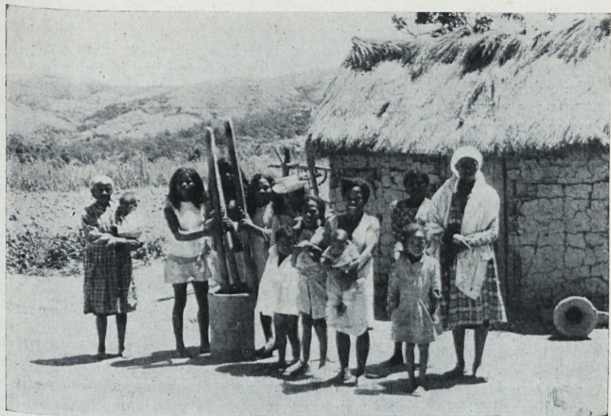
Dekleta pripravljajo riž za kuho. — Spodaj: Zeljnate glave na Madagaskarju.