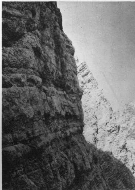
V Triglavski steni (nova varijanta)