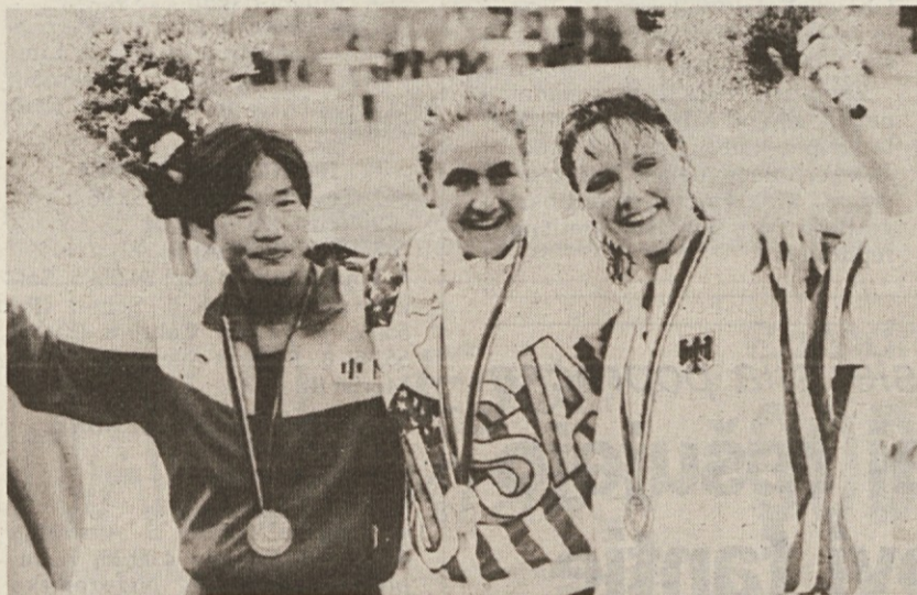
Dobitnice kolajn na 200 m mešano: Kitajka Lin Li (zlato), ki je obenem popravila 11 let stari svetovni rekord Geweningerjeve, Američanka Summer Sanders (srebro) ter Nemka Daniela Hunger (bron)

Včerašnji dan plavalnih tekmovalj bi moral po vseh privedevanjih biti izreden dolgočasen, saj so bili ameriški plavalci veliki favoriti v vseh finalnih obračunih. Končalo pa se je precej drugače: Američani so se morali zadovoljiti le s polovičnim izkupičkom, doživeli pa so tudi marsikatero hudo razočaranje.