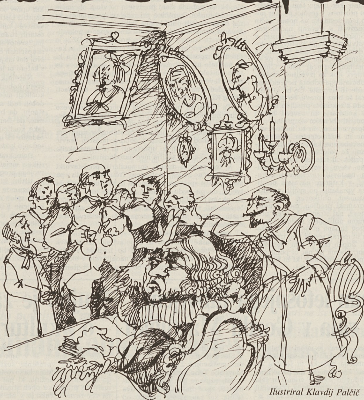
Ilustriral Klavdij Palčič