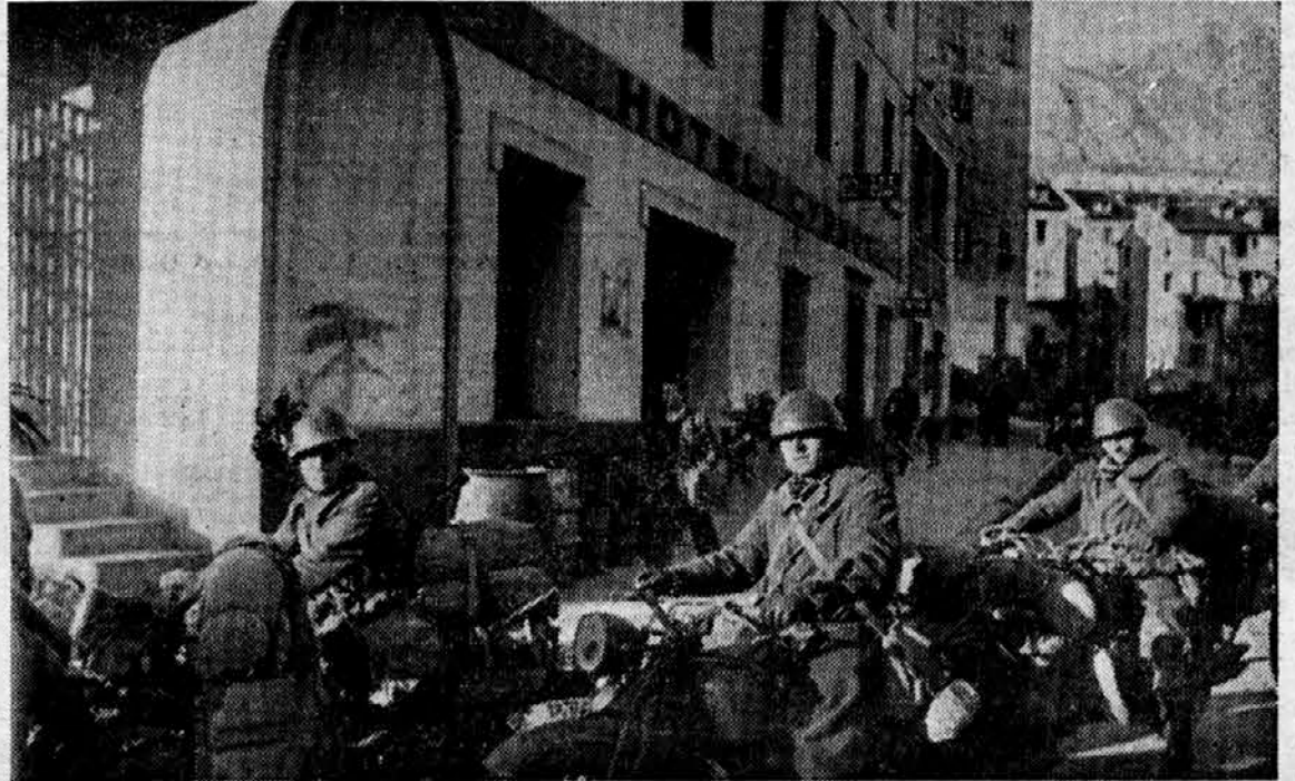
Bersaljeri motociklisti na Korziki.

Vsemogočni Angleški Imperij se neizprosno kruši in se spreminja v državo drugega ali tretjega reda še pred koncem sedanjih sovražnosti.