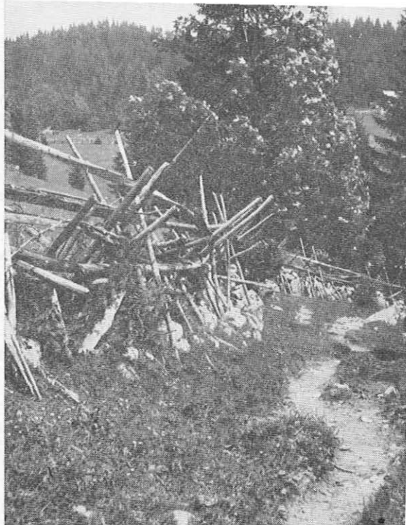
Ograja na kobilah, značilna za Bohinjske planine

Planine, ki so nastajale s krčenjem sredi gozda, so mlajšega nastanka. Mlajšega nastanka so tudi gorske senožeti, za kar govori tudi izraz »rovti«, kakor imenujejo povsod na Gorenjskem gorske košenine. Naravne planinske trate so v pasu, kjer prehaja gozd v travnata goličja, najprej vabile človeka k pašni izrabi. Tudi najzgodnejše doslej znane omembe planin v zgodovinskih listinah se po veliki večini vežejo na planine v visokih legah ob zgornji meji gozda ali prav blizu te meje. Najbolj zgodnja doslej znana omemba se veže na planino Pečano na Jelovici; navedena je v darilni listini cesarja Otona II. iz leta 973 v označbah severne meje škofjeloškega gospostva. 5 Leta 1156 se omenja Mačevska planina v Storžičevi skupini (planina, ki pripada staremu naselbinskemu jedru v Mačah), 6 leta 1377 se omenjata planini Javornik in Lipanca na Pokljuki, 7 iz leta 1444 so sporočena imena treh tržiških planin: Tego-