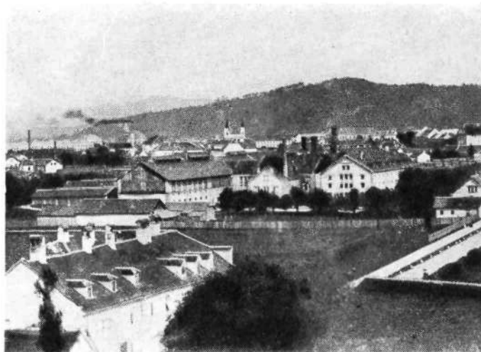
Koslerjeva pivovarna okr. l. 1900. z zapada

zidala nova s parnim strojem 42 k. s.; postavil se je tudi nov kotel z napetostjo 7 atmosfer. Uvedel se je hladilni stroj za umetno hlajenje kleti in mali dinamo za proizvodnjo električnega toka in luči.