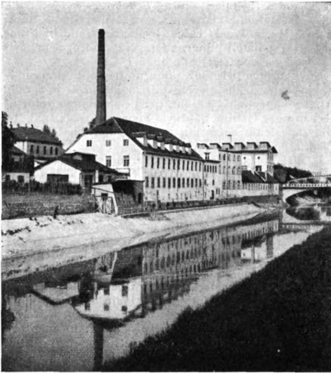
Tvornica kocov Terpine in Zeschko, sedaj Hribarjeva tvornica pletenin v današnjem stanju. Del tvornice, nad katerim se dviga dimnik, je v bistvu le malo spremenjen