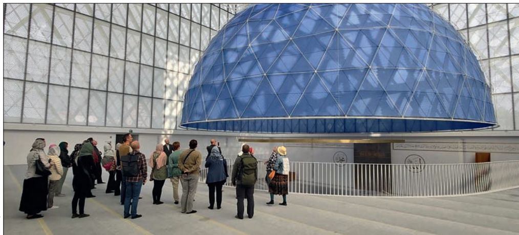
Slika 1: Kratka ekskurzija v Muslimanski kulturni center Ljubljana, ki je pred kratkim odprl svoja vrata.