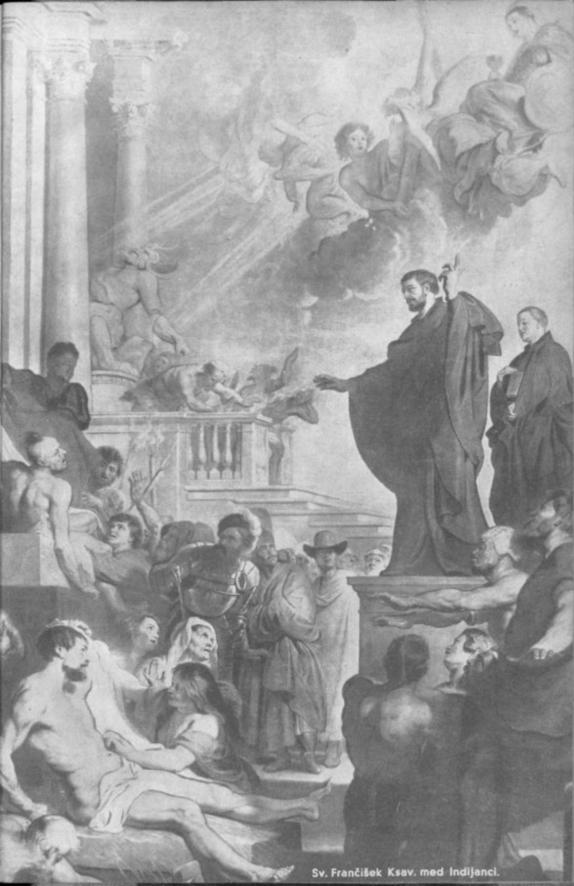
Sv. Frančišek Ksav. med Indijanci.