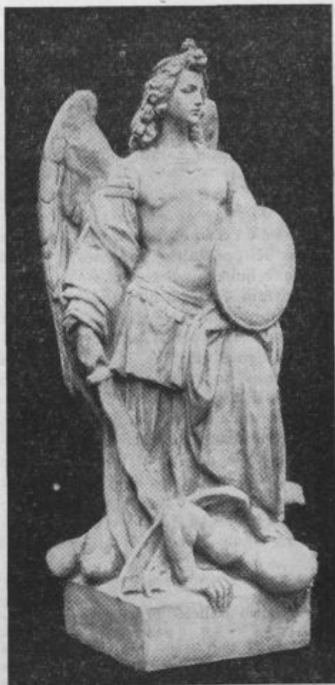
Sveti nadangel Mihael,

Z zadoščevanjem lahko v veliki meri olajšamo Jezusove bolečine in olepšamo podobo božjega kraljestva na zemlji. Z molitvijo, žrtvijo, ljubeznijo, pobožnostjo pomnožimo število dobrih del, ki so vsa v slavo božjega kraljestva. S spravo in zadoščevanjem za grehe drugih, ki morajo