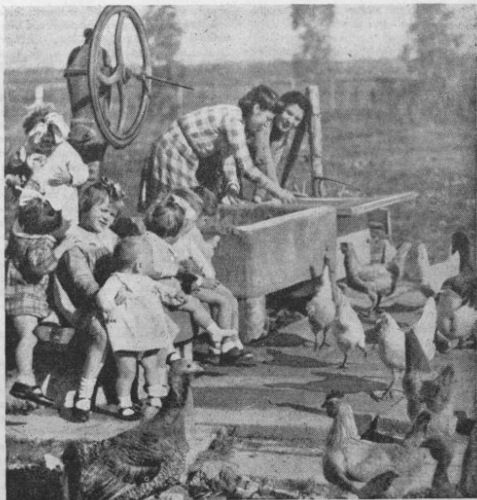
Mladina in perjad v Pontinskem raju. (Glej str. 441.)

sestre in brate. Po njenem prizadevanju so zginile iz hiše slabe knjige, nevarni časopisi, brezbarvni listi, nečedne razvade; namesto njih pa se je naselila v hišo molitev, red, dostojnost in poštenost. Včasih že sam zgled vnete družbenice zadostuje, da starši popolnoma spremenijo svoje mišljenje. Največji blagoslov pa ustvarja Marijina družba družini s tem, da vzgaja čist in neomadeževan rod, ki je najboljša podlaga poznejšim rodovom.