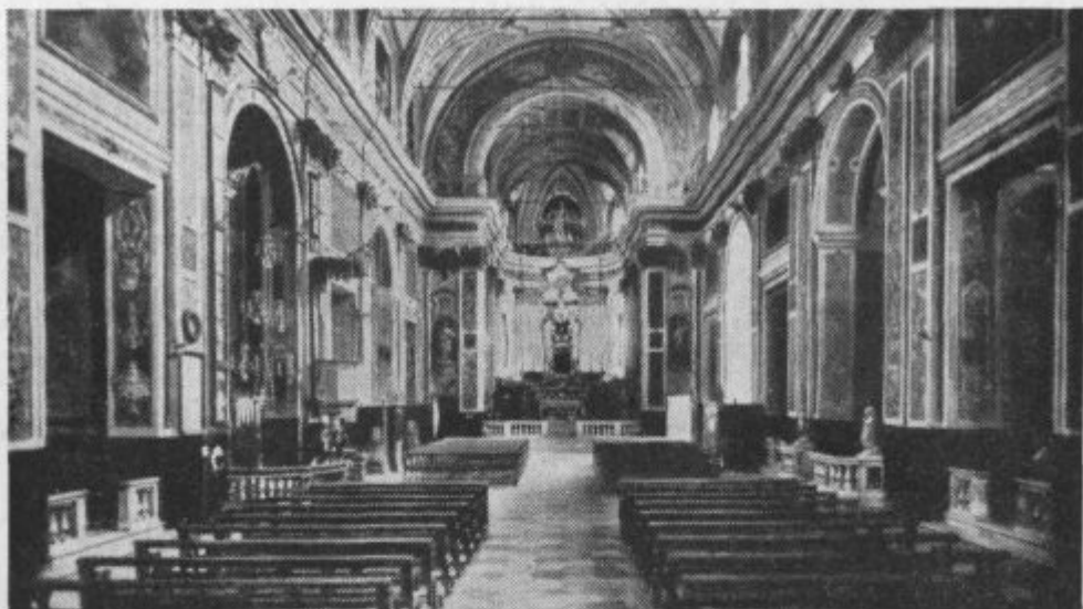
Notranjščina cerkve s čudodelno podobo v mestu Taggia blizu San Remo. (Glej str. 440.)

ce. Njih sreča in tolažba se ne da opisati.