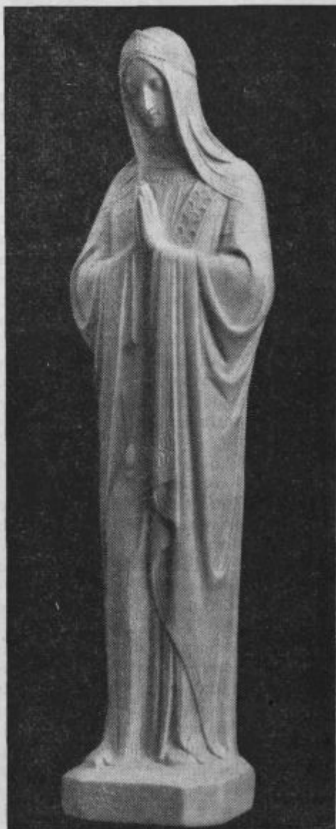
Posoda vse svetosti. (Brezmadežna.)

velike ljubezni in gorečnosti. Izprositi hočemo od Boga usmiljenja in odpuščanja za vse žalitve, ki jih od nas trpi. Zlasti mu hočemo zadoščevati za grehe brezbožnosti, uživanjaželjnosti, materializma in vse njih zle posledice, ki je va-