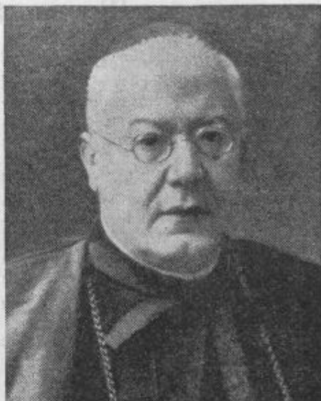
† Kardinal Lauri.

L. 1725. so pri Sv. Frančišku vodili 4 jezuiti ljudski misijon, in sicer dvakrat po osem dni s 4 ali 5 pridigami na dan. Pri procesiji je bilo do 25.000 ljudi, ki so se poprej med misijonom po večini spovedali in prejeli sv. obhajilo. V romarski hiši so spovedovali v prvem nadstropju 3 svetni duhovniki, v 2. nadstropju pa 4 jezuiti. V 1. nadstropju je bila velika soba, kjer se je zbralo do 200 ljudi. Ker je prav tedaj vstopil še en spovednik, je za njim prišlo še nekaj