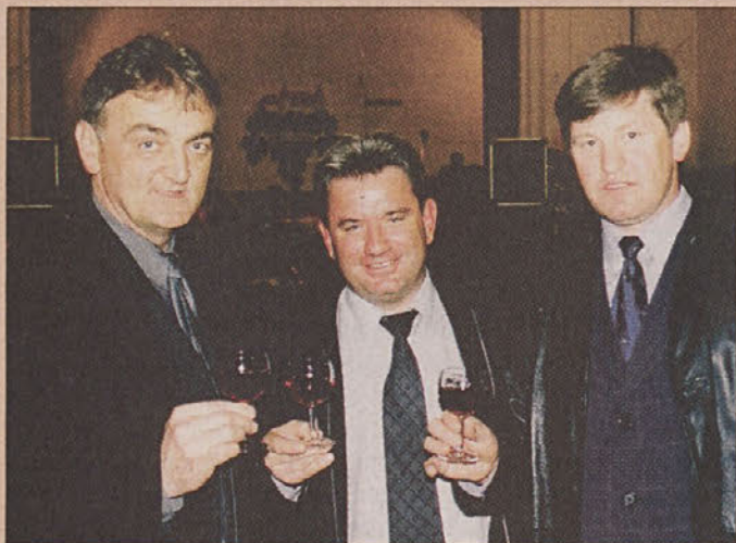
Bilo je nekoč

sosede, med katerimi seveda odnosi niso tako bleščeci. Pravzaprav je medobčinsko posavsko sodelovanje zadnje tedne doživelo nove pretrese