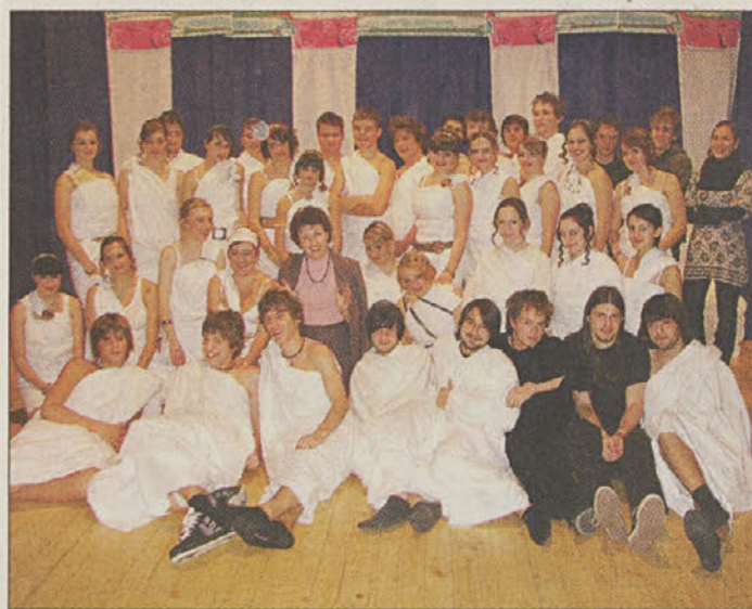
Igralci z režiserko po premierni predstavi

Mladi gledališčniki se bodo v petek, 7. decembra, ob 19. uri z Lizistrato predstavili na odru kulturne dvorane v Sevnici, naslednji dan, v soboto, 8. decembra, pa še v Domu 14. divizije na Senovem, prav tako ob 19. uri. J.K.