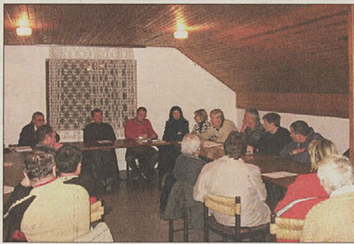
Burna razprava na zboru krajanov Prekope