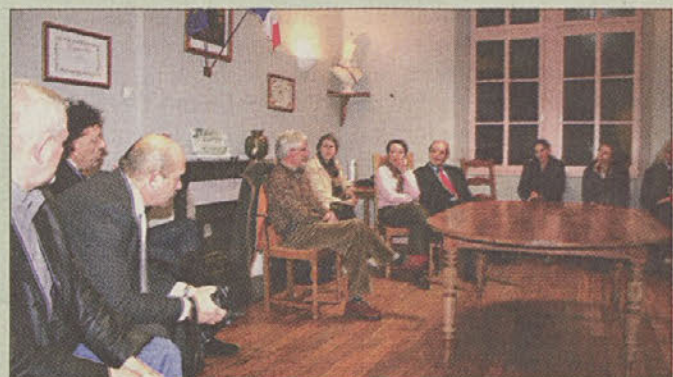
Na obisku pri županu

Površinsko odlagališče v centru de l'Aube je namenjeno vsem kratkoživim NSRAO, ki nastajajo v jedrskih elektrarnah v Franciji ter pri ostalih proizvajalcih teh odpadkov (kot npr. medicina, industrija, raziskovalna dejavnost ter odpadki iz vojaških aplikacij). Ima kapaciteto 1.000.000 m 3 , zgrajeno pa je v obliki površinskih betonskih odlagalnih celic, ki se po zapolnitvi z radioaktivnimi odpadki zabetonirajo, kasneje pa se prekrijejo z zaporednimi plastmi različnih materialov, ki ne prepuščajo vode. Odlagališče je skrbno nadzorovano, izvajajo se meritve vseh možnih prenosnih poti v okolje in do človeka. Zato se redno zajemajo vzorci zemljin, vode, zraka, krmil, živil in prehrabnih izdelkov na samem odlagališču in v širši okolici. Odlagališče je začelo z obratovanjem leta 1992 in bo predvidoma obratovalo 60 let. Po končnem zaprtju pa se predvideva še nadzor različne intenzivnosti za obdobje do 300 let.