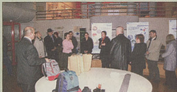
Odlagališče de l'Aube

Predstavniki Brežic so se sestali tudi s predstavniki krajanov, ki živijo v neposredni bližini obeh odlagališč. Seznanili so se z njihovimi pogledi in pridobili informacije o sobivanju z odlagališči. Predvsem jih je zanimal francoski primer dodeljevanja nadomestil oziroma taks, ki se izvaja v koncentričnih krogih glede na oddaljenost od odlagališč. Prav tako so bile zanimive informacije lokalnih prebivalcev, da so vrednosti nepremičnin celo narasle, prav tako pa niso zaznali upad vrednosti kmečkih pridelkov in ostalih proizvodov, čeprav je L'Aube samo 15 km oddaljen od Champagne, kjer pridelujejo svetovno znane vrste šampanjca. Pridobili pa so tudi izkušnje lokalnih predstavnikov glede vključevanja v obratovanje in sam nadzor. Pridobljene informacije bodo služile nadaljnjemu načrtovanju izvajanja lokalnega partnerstva v Brežicah, francoske izkušnje pa kažejo, da odlagališče lahko uspešno zagotavlja trajnostni razvoj.