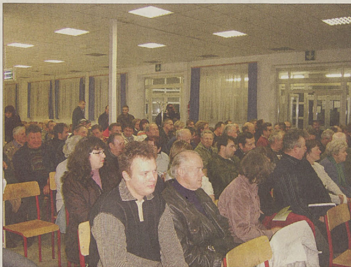
...na strani 3 Krajani iz okolice letališča niso zadovoljni s tistim, kar jim ponuja država.