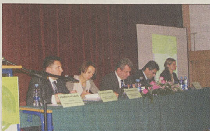
Gostje predstavljajo gospodarsko središče Feniks.

Resolucija o nacionalnih razvojnih projektih do leta 2023 zajema tudi gradnjo novega razvojnega središča v Posavju, znanega kot projekt Feniks. 160 milijonov evrov vredna investicija zajema gradnjo gospodarsko-logističnega centra, ki bo omogočil razvoj regije in zagotovil okoli 2000 novih delovnih mest. Center gospodarsko-razvojno-logističnega središča v Posavju bo zgrajen na območju letališča Cerklje ob Krki, v neposredni bližini avtoceste, železnice in letališča. Zaradi svoje lege bo predstavljal most med EU in jugovzhodno Evropo in preko nje do Azije. Neposredna bližina meje s sosednjo Hrvaško, ki je hkrati tudi schengenska meja, pa predstavlja dodatne priložnosti.