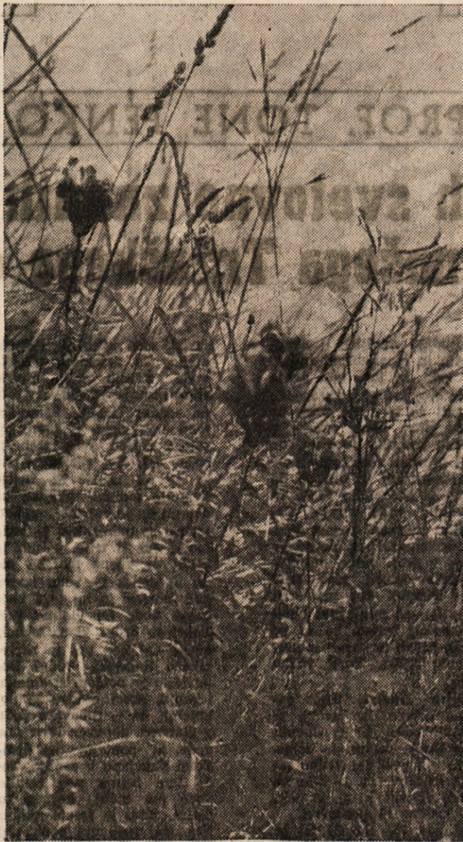
DEVINSKA SKALA, ZARI V RDECEM CVETJU • SEBOJU.

In proti Trstu ob morju je Devin. Kdo ne pozna devinskega gradu, starega in novega. Iz novega se nam reže kruh in deli pravica. Tam je danes vrhovno poveljstvo vojaške uprave. Čudovita lega. Strme stene. Temno modro morje, nad njim pa grad. In kadar posije v njegova okna večerno sonce, kdo bi ne bil val rad v tej prelesti. Toda kako malo je izvoljenih. Na strmih pečini, ki raste iz morja, so poleg novega gradu razvaline starega gradu. Kakor je novj ves razkošen v zahajajočem soncu, tako so te ruševine čudovite in bajne ob mesečini. Pridi in nehote boš občutil, da tuč v tebi zveni pesniška duša. En tak večer ob starem gradu, ko pljuska svojo večno pesem ob skale temno morje, v daljavi se ti smeje razsvetljeni Trst, na nebu ti mežikajo mesec in potuje z zvezdami tiho svojo pot, ti bo ostal v spominu. Toda devinska skala je tudi podnevi nekaj posebnega. Vsa je prerasila z južnim grmičevjem in cvetjem. V prelepem mesecu maju je vsa posuta z lilastim in rdečkastim šebojem ali matiolo. In devinsko vino! Kadar so imeli na starodavnem cesarskem dvoru v Rimu posebno slavnost ali go-