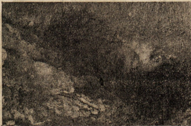
PODKAL PRI NABREZINI.

če ne boste zgrešili. Po tisti gmajni onkraj železnice se kaj rado zaide. Dolina je podobna dolini, skala skali, grm grmu. Toda končno boste le prišli, posebno če vam bo ljubezniv in ustrežljiv čomačin pomagal. Veličasten vhod in veličastna pečina! Široka, visoka. Po mali začetni strmini pa je skoraj ravna in tako široka, da bi nemoteno vozila po njej vstric dva kamiona. Ta pečina je znamenita. Znanstveniki so našli v njej gomile vseh mogočih kosti, raznovrstnih živali, o katerih danes v okolici Gabrovca ni ne duha ne sluha. Kosti jamskega medveda, jamskega leva, jamske hijene in še mnogo drugih. Seveda teh kosti ni danes več tam. Vse so razkopali in