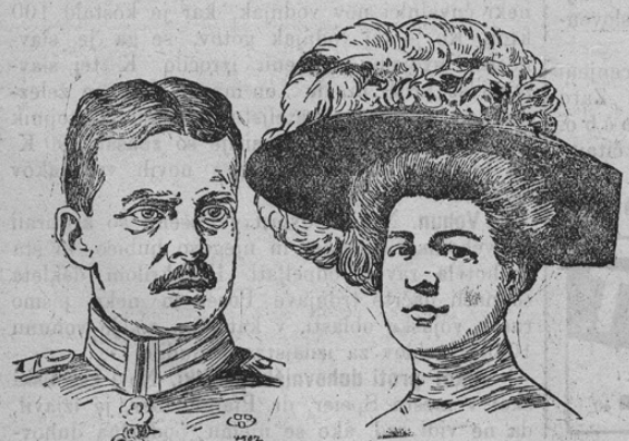
Prinz Georg von Bayern und seine Braut Erzherzogin Isabella