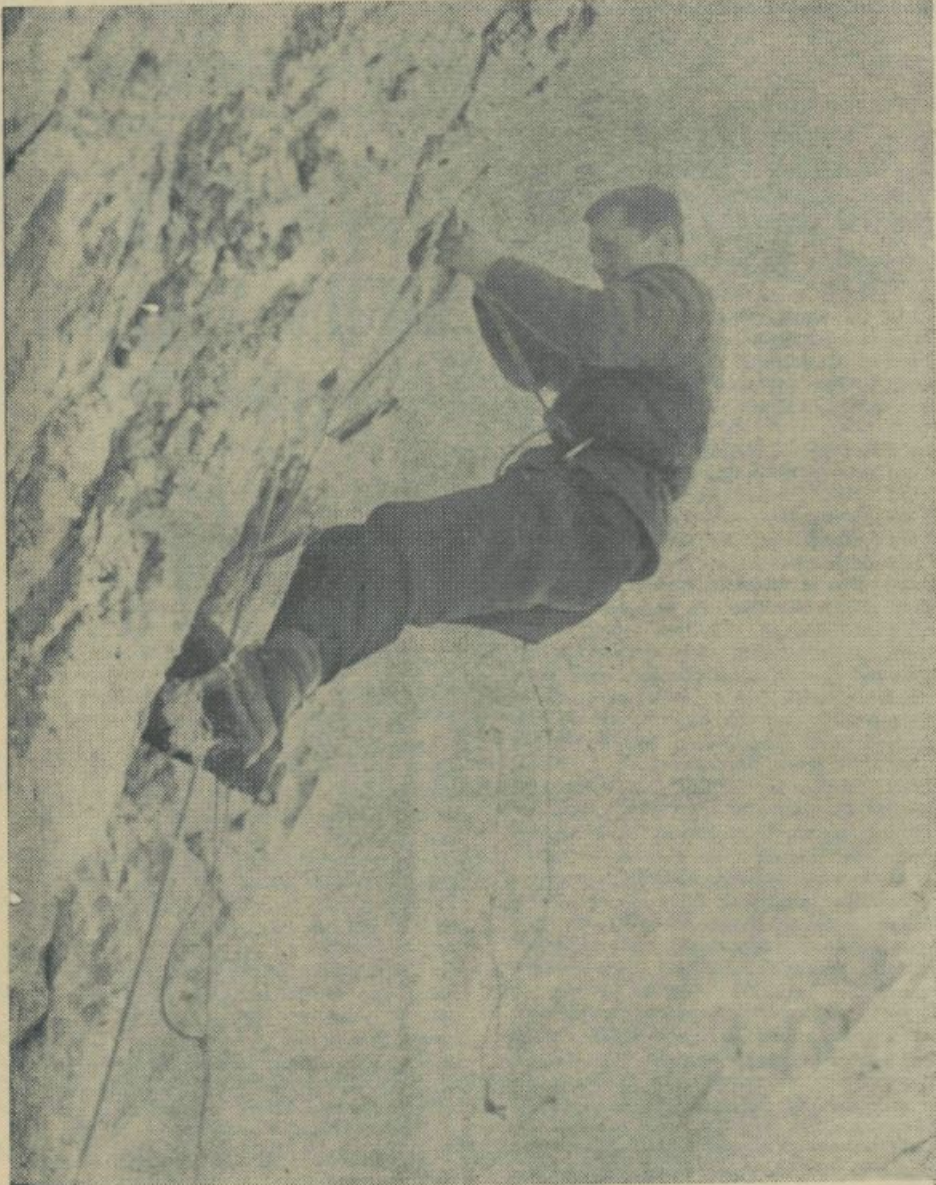
V previsu