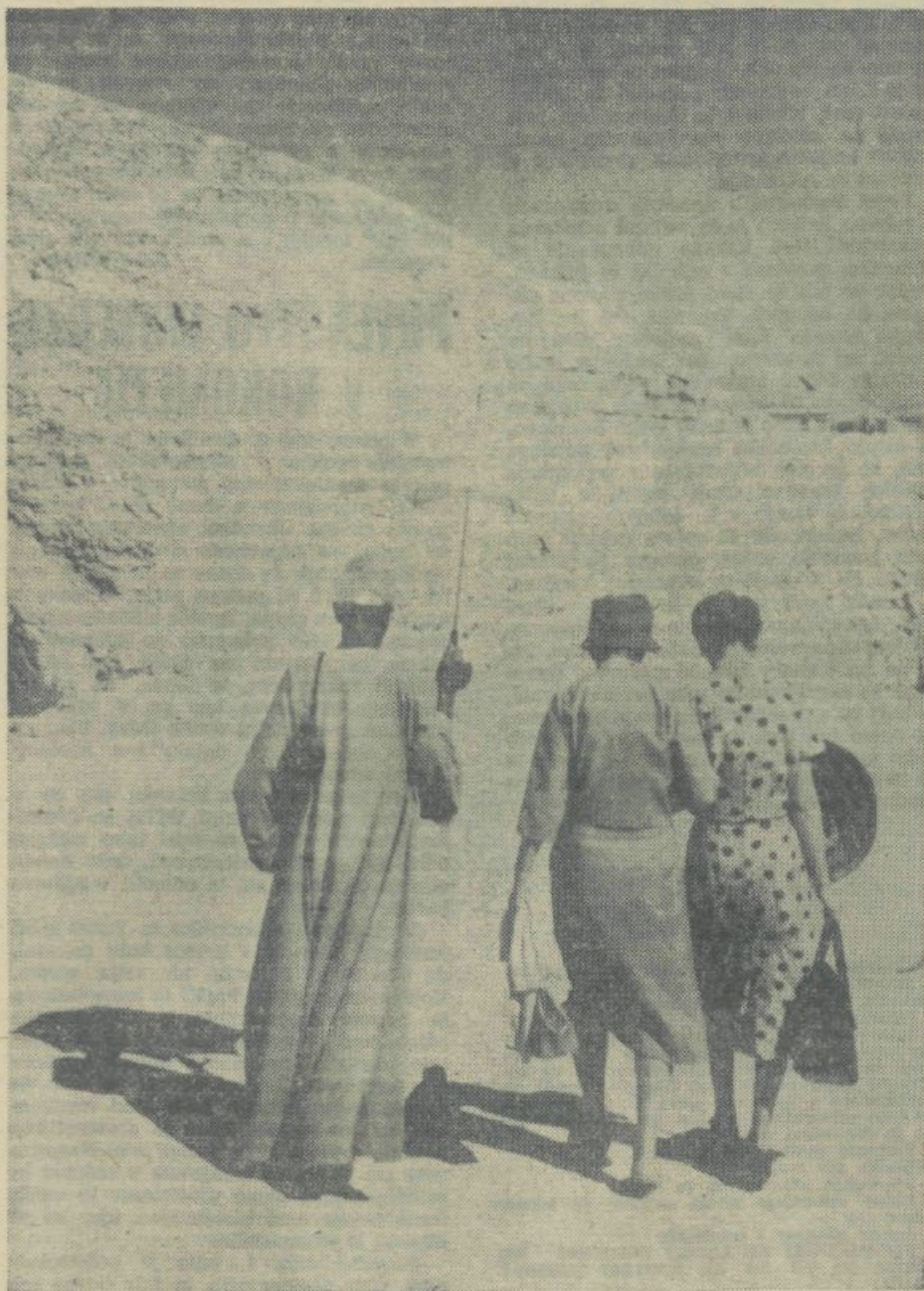
»Nosača«, foto: Joco Žnidaršič