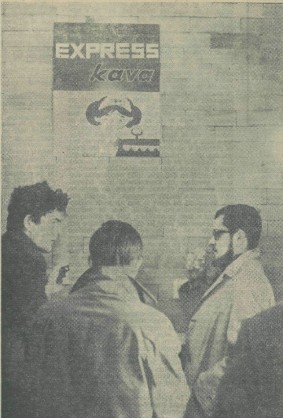
Vmesna postaja