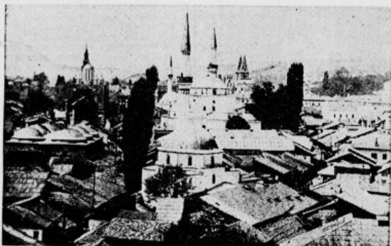
Pogled na Sarajevo