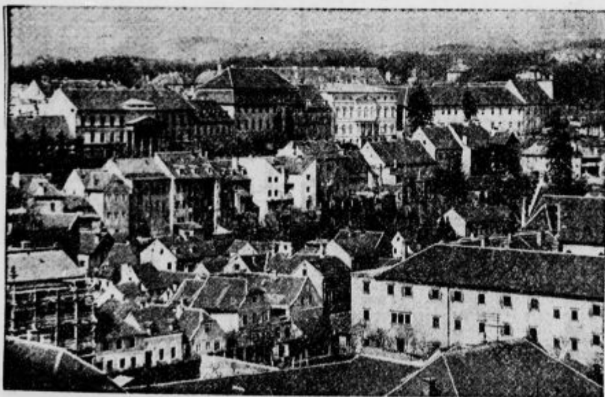
Zagreb — pogled na zgornje mesto

Naročite se na knjižnico še danes pri upravi knjižnice, Ljubljana, Kopitarjeva 6 ali v Ljudski knjigarni ali v njeni podružnici na Miklošičevi c. 5