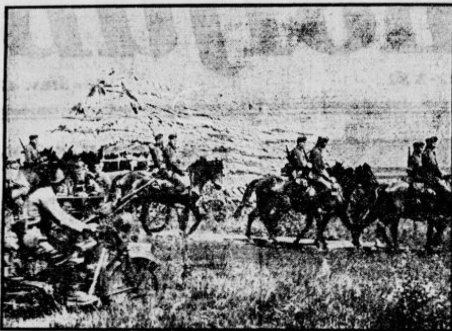
Nagle italijanske in nemške enote ob Donu na pohodu.