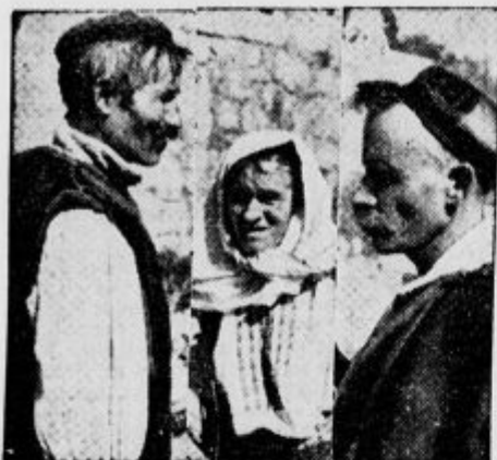
Hercegovinske hrvaške narodne noše