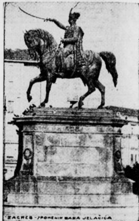
Jelačićev spomenik v hrvatski prestolnici