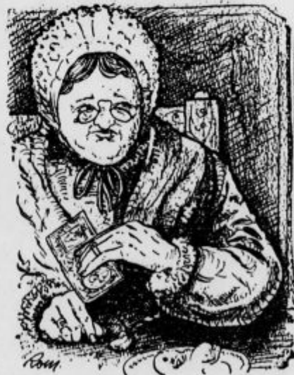
»Ali je mogoče, da pridemo tej reči do dna?«

»Gospa,« sem odvrnil, od sile sem vesel, da vas morem pozdraviti, bodite prepričani. Moja zgodba je nekam dolga, ampak srečanje z vami mi je vendarle zelo dobrodošlo, čeprav je zdajle prav nepričakovano. Prepričan sem,« toda pri teh besedah sem spoznal, da nisem bil prav o ničemer prepričan. Zaradi tega sem pričel iznova: »Čast mi je,« sem rekel, tedajci pa sem spoznal, da mi je