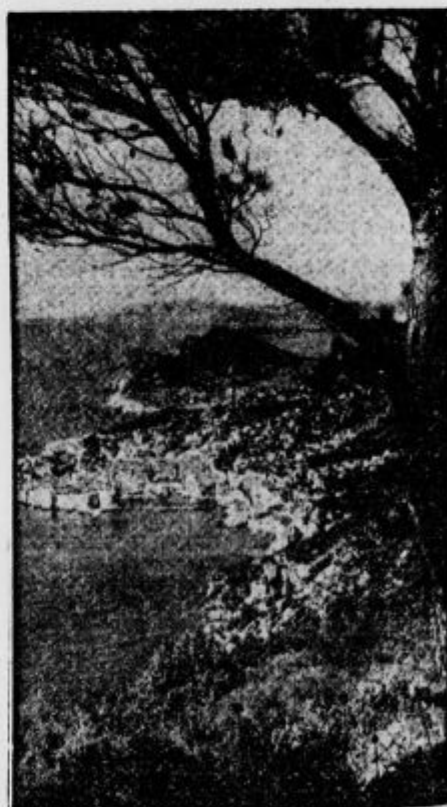
Hrvatsko obmorsko pristanišče Dubrovnik