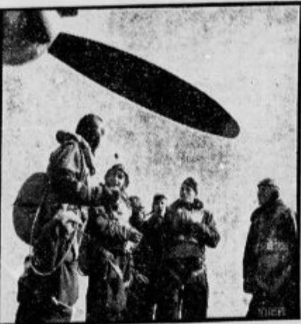
Italijanski lovski letalec malo prej, preden odleti v boj.