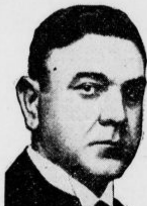
Poglavnik Hrvatske dr. Ante Pavelić