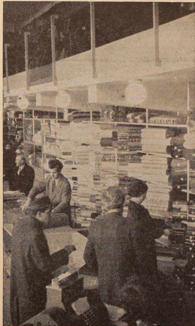
Vsakdanji prizor iz naših trgovin. Ni dovolj, da je trgovina dobro založena. Tudi urejenost lokalov sodi k sodobnemu trgovanju. (Lokal trgovskega podjetja »Plavica« v M. Soboti)

Dohodki lanskoletnega proračuna so znašali 399 milijonov izdatki pa 377 milijonov dinarjev. Zavodi s samostojnim finansiranjem so v lanskem letu z dohodki pokrili izdatke, manjše izgube so prikazane le v Zdravilišču Slatina Radenci in Splošni bolnišnici v Murški Soboti.