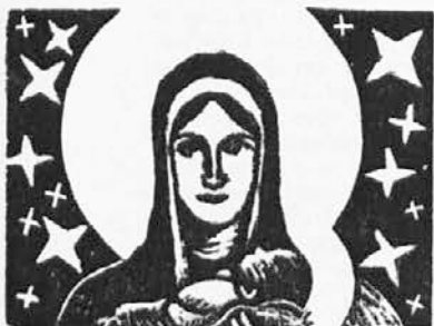
r o d i l a »