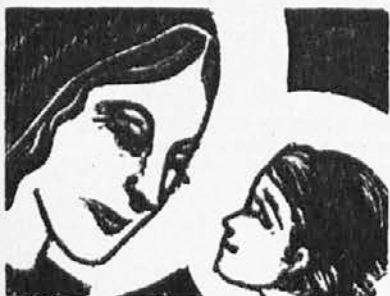
v templju našla»