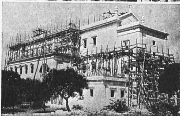
Zgoraj: Veliki vhod v naravno svetišče Irijske globeli. Spodaj: Veličastna bazilika, ki jo še gradijo.

Cerkvena oblast je bila sprva v sodbah glede Fatime zelo previdna. Skof je prišel v Fatimo uradno l. 1927, torej šele ob desetletnici prikazovanja, ko je blagoslovil zidani križev pot ob trinajst kilometrov dolgi cesti, ki vodi iz Leirije v Fatimo. Osem let je cerkvena oblast vestno in vsestransko preiskovala fatimske dogodke. Šele dne 15. oktobra 1950 je leirjski škof objavil »Pastirski list o češčenju rožnovenske Matere božje v Fatimi«. Po opisu prikazovanja in dela preiskovalne komisije slovesno izjavlja: