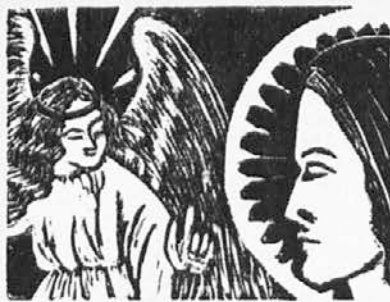
od Svetega Duha spočela»