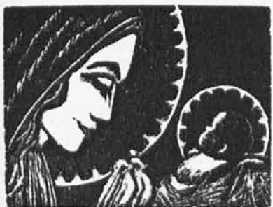
v templju darovala»