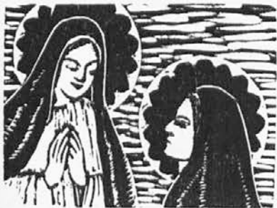
v obiskovanju Elizabete nosila»