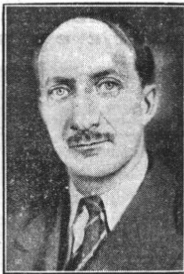
Francoski zunanji minister Georges Bonnet, ki je podpisal za Francijo francosko-nemško pogodbo. Zdaj mu delajo preglavice Lahji s svojimi zahtevami po francoskih kolonijah

delovanja z našim največjim sosedom Nemčijo, ker vemo, da je to sodelovanje potrebno in so ga tudi že prej mnogokrat poudarjali naši veliki učitelji. Zelimo prav tako dobro sodelovanje s Poljsko in Madžarsko in, samo po sebi se raz-