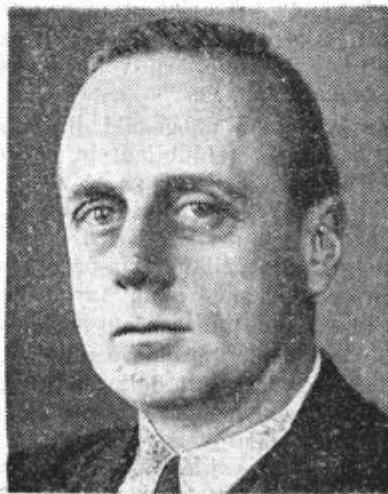
Nemški zunanji minister Joachim v. Ribbentrop, ki je nedavno podpisal nenapadalni pakt med Nemčijo in Francijo

me, tudi z Romunijo in Jugoslavijo. Romunija in Jugoslavija sta nam dokazali v najtežjih časih in v najbolešnejših trenutkih naše zgodovine odkritosrčno sočustvovanje in simpatije, za kar se jima moramo od vsega srca zahvaliti.«