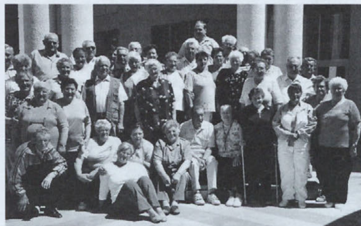
Skupinski posnetek pred hotelom Delfin

Zato tudi v našem društvu zremo v prihodnost in poskušamo uresničiti načrte in želje v sedanosti. Na občnih zborih sprejemamo programe po željah in možnostih naših članov. V pomladnih in jesenskih mesecih organiziramo izlete in letovanje v naše slovensko primorje. Julija in avgusta imamo piknike, pred novim letom pa že tradicionalno novoletno srečanje. Oktobra, ko je mesec starejših, povabimo vse občane, stare nad sedemdeset let, v dvorano, kjer jim pripravimo kratek kulturni program ter se z njimi poveselimo. Pred božičnimi prazniki obiščemo vse občane, ki so stari nad 80 let, jih obdarimo s skromnimi darili in jim zaželimo zdravja in sreče. Med letom pošljemo vsakemu članu čestitko ob rojstnem dnevu in jih tako razveselimo, saj že mnogi ne morejo med nas.