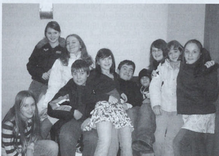
Mlade igralke in igralci (Tistega lepega večera v Mezgovcih)

Kot pomembno prireditev za našo vas s ponosom štejemo tudi prireditev ob dnevu žena in materinskem dnevu. S ponosom zato, ker smo jo letos marca izvedli že dvaintridesetič. Letošnja prireditev je nosila naslov Tistega lepega večera v Mezgovcih. Mislim, da je prireditev opravičila svoj naslov, saj se je svojim mamam v kulturnem programu s svojim trudom zahvalilo kar dvaintrideset nastopajočih otrok in najstnikov.