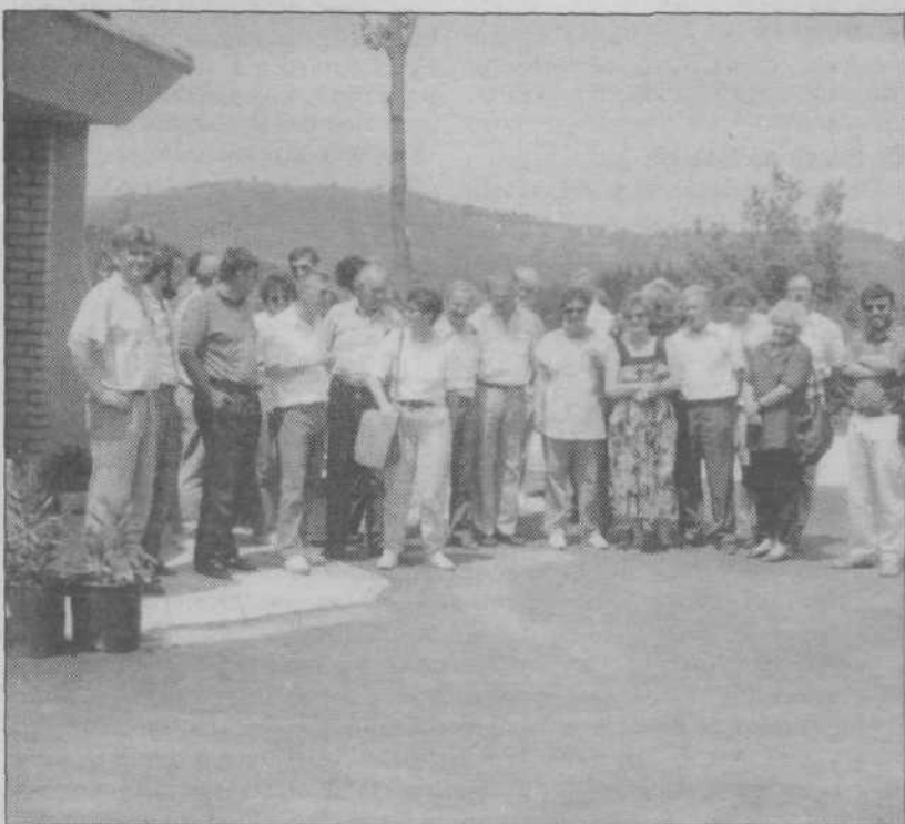
Na Prežganju, pred osnovno šolo, na še sveže asfaltiranem dvorišču.