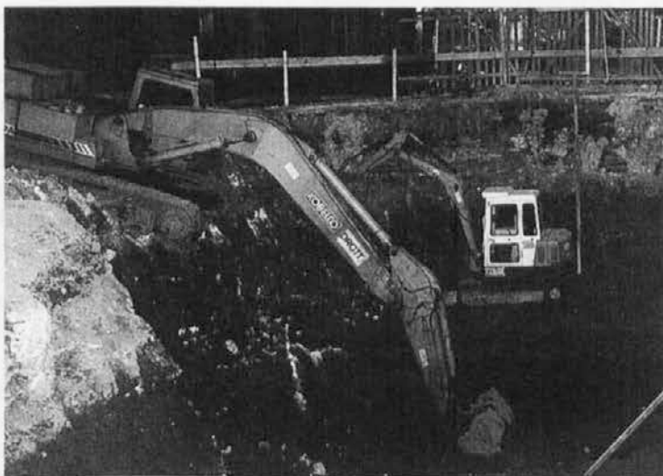
Gradbena jama konec novembra