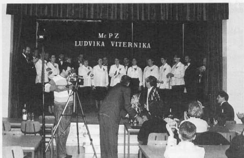
MePZ Strojnska Reka od 13. novembra nosi ime po Ludviku Viterniku.