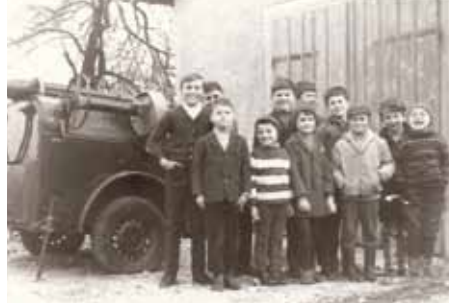
Najmlajši člani, februar 1972

Novo obdobje v življenju društva se je pričelo leta 1971. Gasilci in ostali vaščani smo s prostovoljnim delom uredili okolico starega doma, leto kasneje je bilo v društvo sprejetih 23 novih članov.