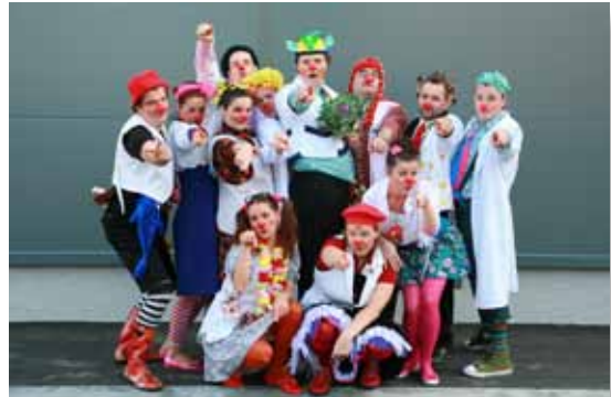
Arhiv: Rdeči noski

Na otroških oddelkih smo postali del bolniškega vsakdana. Prinašamo igrivo atmosfero, svet fantazije in dobro voljo, kar pripomore k temu, da se bolniki in njihovi starši sprostijo in malce razbremenijo. Tudi osebe v bolnišnicah, če le more, z nami ujame ritem. Male bolnike obiskujemo v njihovih sobah v parih in jih glede na široko paleto znanj in izkušenj zabavamo s plesom, glasbo, žongliranjem, čarodejstvom in pantomimo, odvisno od vsakega posameznega otroka in njegovega odziva. Namen vsega obiska je privabiti nasmeh na otroške obraze in ustvariti veselo vzdušje. Ko klovna zapustita pacientovo sobo, pustita za seboj čustveni spomin, ki buri otroško fantazijo in budi veselje, še dolgo po tistem, ko sta odšla. Čedalje pogosteje pa se dogaja, da nas sestre povabijo, da ostanemo v sobi ali nas celo pokličejo v intervencijsko sobo, ko opravljajo preiskave in izvajajo terapije. Strah pred bolečino in neznanim lahko medtem, ko potekajo priprave na poseg, neskončno zraste. Bolj ko je otrok tesnoben, težje je izvesti preiskavo.