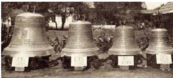
Šmarnogorski zvonovi

2. julija 1928 so člani društva sodelovali pri dogodku, ki je pomemben še v današnjih časih. Na ta dan so se na Šmarno goro vlekli novi zvonovi, pri tem delu pa je sodelovalo 13 članov našega društva.