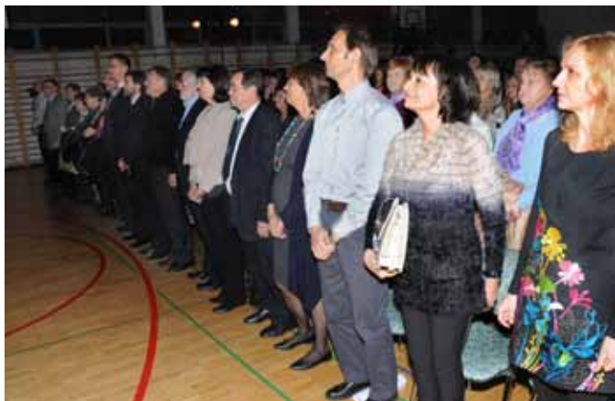
Utrinek s prireditve - himna