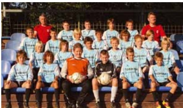
U10, vir: arhiv NK Tabor

Trenutno sta najboljši generaciji v selekciji U10A in MD (mlajši dečki). S povečanjem števila otrok in še strokovnejšim delom trenerjev se je kvaliteta mlajših selekcij zelo dvignila, zato dosegamo zelo visoke uvrstitve. Pričakujemo, da se bo vse to z leti preneslo v višje selekcije, saj jih zapolnjujemo z doma vzgojenimi igralci.