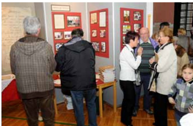
Utrinek z razstave