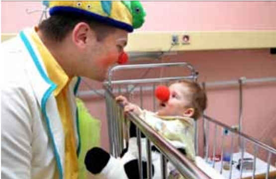
Arhiv: Rdeči noski

V tem prispevku želimo Rdeči noski predstaviti svoje delovanje in se hkrati zahvaliti Četrtni skupnosti Šentvid, ki nam že vrsto let v uporabo brezplačno nudi svoje prostore, kjer lahko naši klovni zdravniki, ki predstavljajo srž društva, vadijo. Vaje in delavnice, ki jih Rdeči noski organiziramo, so za naše delovanje izrednega pomena, saj se le na tovrsten način lahko izobražujemo in posledično dvigujemo kvaliteto svojega dela.