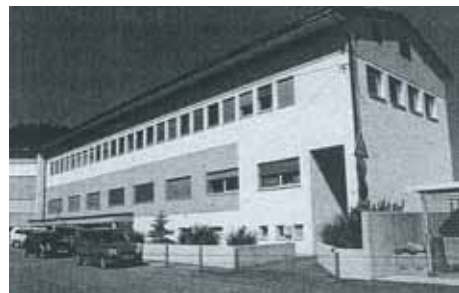
Zdravstveni dom Šentvid sedaj (slika iz l. 2002)

Ko se je leta 1898 ljubljanskemu škofu Antonu Jegliču porodila zamisel, da bi v Šentvidu zgradil (takrat imenovane) Škofove zavode, je bil Anton Belec skupaj s takratnim župnikom gospodom Malovrhom zelo zaslužen, da je bil Zavod sv. Stanislava res zgrajen. Tako je v Škofovih zavodih leta 1905 začela delovati prva slovenska gimnazija, ki je celoten pouk (z izjemo učenja tujih jezikov) izvajala le v slovenskem jeziku. Več kot stoletna tradicija se nadaljuje še danes, saj je Zavod sv. Stanislava pomembna vsestransko izobraževalna ustanova v Šentvidu. V Šentvidu je živel ali deloval tudi mnogo znanih zdravnikov: Prof. Edo Šlajmer, dr. med. (1869-1935) je živel na Poljanah v Šentvidu. Deloval je v splošni bolnišnici kot zelo znan kirurg, veliko je operiral v Leonišču, zelo znana je tudi njegova Šlajmerjeva bolnišnica.