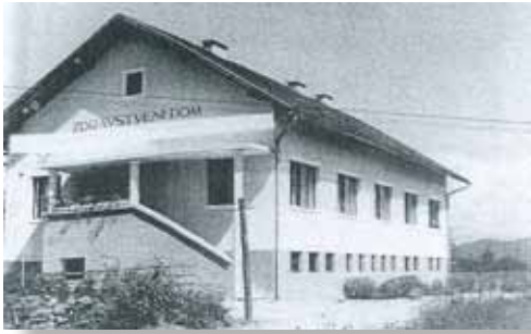
Zdravstveni dom v Šentvidu pred 2. svetovno vojno

Zapiski o organiziranem zdravstvu nekdanje občine Šentvid izvirajo šele iz druge polovice 18. stoletja. Pred tem časom sicer lahko najdemo posamezne zapiske o kužnih boleznih in nesrečah, vendar ne moremo govoriti o organiziranem zdravstvu.