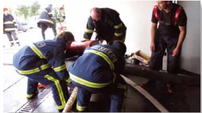
Črpanje vode, poplave v Ljubljani, september 2010, vir: Arhiv PGD Medno

PGD Medno ima 103 člane, med nami je 45 operativnih članov in članic in 25 mladih članov (od 7 do 18 let starosti), kar nas uvršča v eno izmed osmih (po kategoriji, ne aktivnosti) najmanjših društev v Gasilski zvezi Ljubljana.