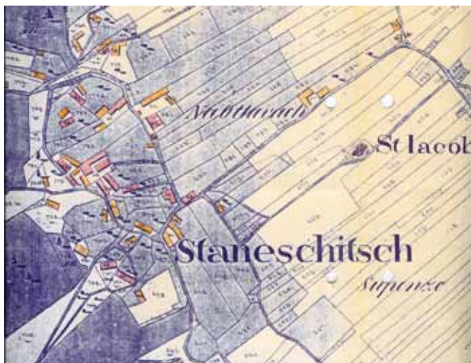
Stanežiče na karti leta 1826

Če v letu 1826 govorimo o približno 39 hišnih številkah v Stanežičah in 13 hišnih številkah v Dvoru, imamo danes v letu 2011 v Stanežičah najvišjo hišno številko 128 in v Dvoru najvišjo hišno številko 33. V sedanjem številčenju so praznine zaradi pogorelih ali porušениh hiš, nekaj jih manjka zaradi rezervacij hišnih številk, veliko hiš pa je označenih z dodatki A, B, C, tja do M, na primer pri hišni številki Stanežiče 7.