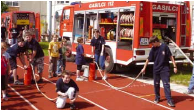
Mladi člani PGD Medno na obisku v OŠ Šentvid

smo dostojno zastopali društvo v Beogradu, leta 2009, 2010 in 2011 pa v Avstriji. Nekaj let že preizkušamo svoje tekmovalne sposobnosti na tekmovalnem področju Pokal Gasilske zveze Slovenije, dvakrat smo samostojno organizirali eno od teh tekem, na tekmovalnem področju smo eno boljših društev v Gasilski zvezi Ljubljana.