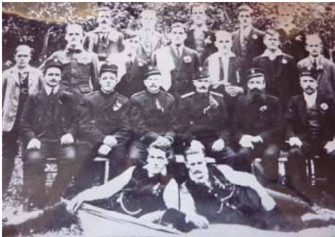
Prva »gasilska« slika članov PGD Medno

Pred 91 leti, 14. avgusta 1920, je bilo ustanovljeno prostovoljno gasilsko društvo Medno. Ob ustanovitvi je bilo v društvo vpisanih 27 članov, vaščanov Medna.