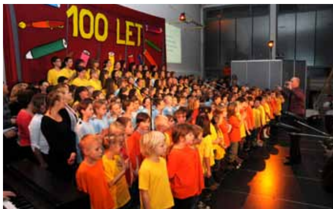
Utrinek s prireditve - šolski pevski zbor

Starašinič, župan mestne občine Ljubljana gospod Zoran Janković ter minister za šolstvo in šport gospod Igor Lukšič.