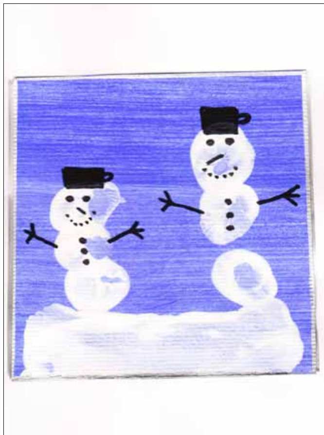
Vrtec Šentvid, enota Mravljiniček