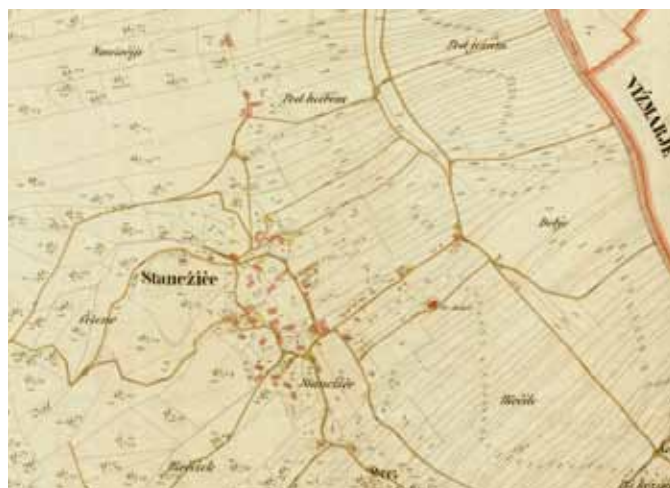
Stanežiče na karti leta 1868

koncih vasi nosili zaporedni številki. Hišna številka Stanežiče 59 je bila dodeljena hiši ob glavni cesti Ljubljana-Kranj, hišno številko 60 pa je nosila hiša v vasi. V Dvoru so zmedo pri oštevilčenju manj občutili, ker je bila vas manjša pa tudi novogradenj je bilo tam manj.