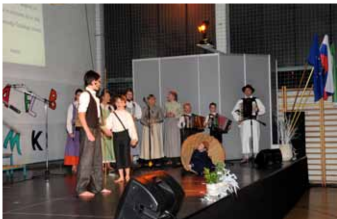
Utrinek s prireditve - šolska folklorna skupina

V času 1. svetovne vojne je šolska zgradba nudila streho učencem, vojakom in ranjencem. V obdobju med obema vojnama je bila šola nekoliko nadzidana in stavba je pridobila dodatne prostore za meščansko šolo.