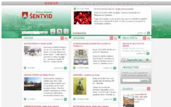
spletna stran ČS Šentvid