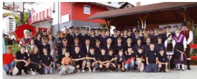
Člani, gasilski dom in okolica ob 90. letnici društva

V zadnjem desetletju smo temeljito prenovili gasilski dom od strehe, orodišča, garaže, dvorane ob orodišču, zamenjali smo vsa okna, polepšali fasado, ob domu je zrastle brunarica, povečali smo ploščad, avtorsko delo mlade generacije pa sta koša za košarko, zadnja, letošnja pridobitev je nova, sodobna peč za centralno ogrevanje.