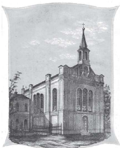
Evangeličanska cerkev v Ljubljani

Proslavljanje 500. obletnice Trubarjevega rojstva je bila priložnost, da so strokovnjaki z raznih področij osvetlili protestantizem na Slovenskem, njegovo delovanje in pomen. Samo v Prekmurju sledijo Luthrovemu nauku neprekinjeno vse do danes. Drugačne razmere pa so bile v osrednji Sloveniji in te smo želeli predstaviti z dokumenti o delovanju evangeličanske cerkve v 19. stoletju, ki jih hrani knjižnica Narodnega muzeja Slovenije.