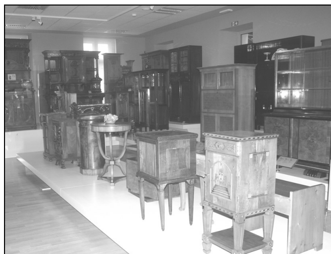
Študijska zbirka shrambnega pohištva (foto: Tomaž Lauko (NMS)).

Taka je (in bo) naša sedanja razstava, seveda pa bodo nedvomno isti predmeti in iste zbirke v prihodnjih desetletjih in stoletjih, v oskrbi naših naslednikov, vedno znova reinterpetirani in vključeni v številne druge kontekste, ki si jih v tukaj in zdaj sploh še ne zmoremo zamisliti. Zato je ključno, da jih ohranimo, in to v čim boljši kondiciji. S spoštovanjem se spominjamo zavzetih skrbnikov, ki so se trudili za pridobivanje vseh teh predmetov in ki so zaslužni za rast našega muzeja kot shrambe in izložbe dosežkov prednikov in prič preteklosti. Ta sodobna razstava (in depoji) naj bo tudi v poklon vsem ljudem, ki so z darovi, volili, prodajo, svojim angažmajem, od župnikov do plemičev, od tovarnarjev do kmečkih gospodarjev prispevali k njih-