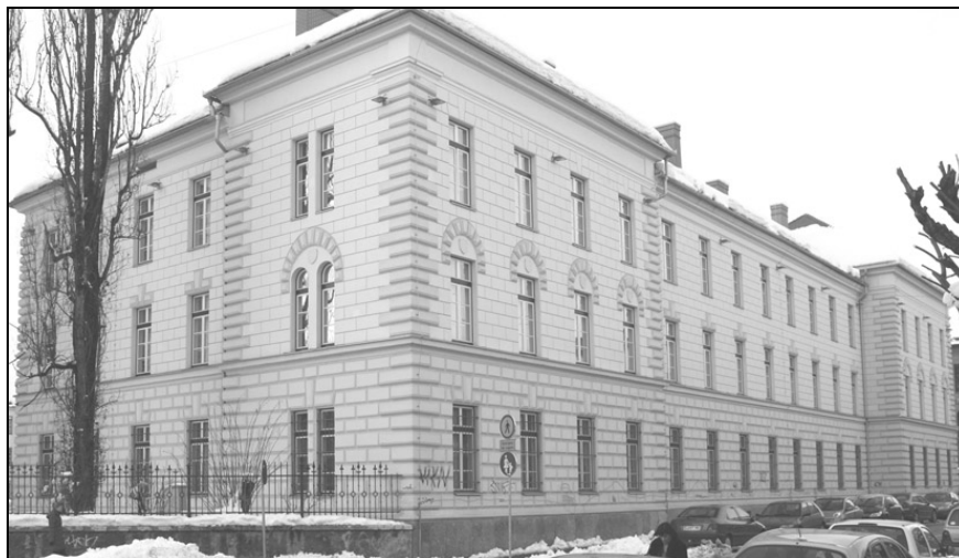
Stavba NMS z Maistrove ulice.

Na ogled so v novi stavbi, ki jo je Narodni muzej Slovenije (poleg matične palače na Prešernovi ulici, v kateri je stalna razstava najzgodnejših obdobj) pridobil v nekdanji vojašnici, v sosedstvu Slovenskega etnografskega muzeja, Moderne galerije, Kinoteke in Zavoda za varovanje kulturne dediščine. Bližina drugih muzejev kar kliče po snovanju vsebinsko komplementarnih razstav. Preoblikovanje kompleksa Metelkova je delo arhitekturnega biroja Groleger. V novi stavbi Narodnega muzeja Slovenije (skupaj skoraj štiri tisoč kvadratnih metrov) je klet namenjena depojem, zastekljeni prizidek restavratorskim delavnicam in predavalnici, pritličje občasnim razstavam, obe nadstropji pa stalni razstavi študijskih zbirk.