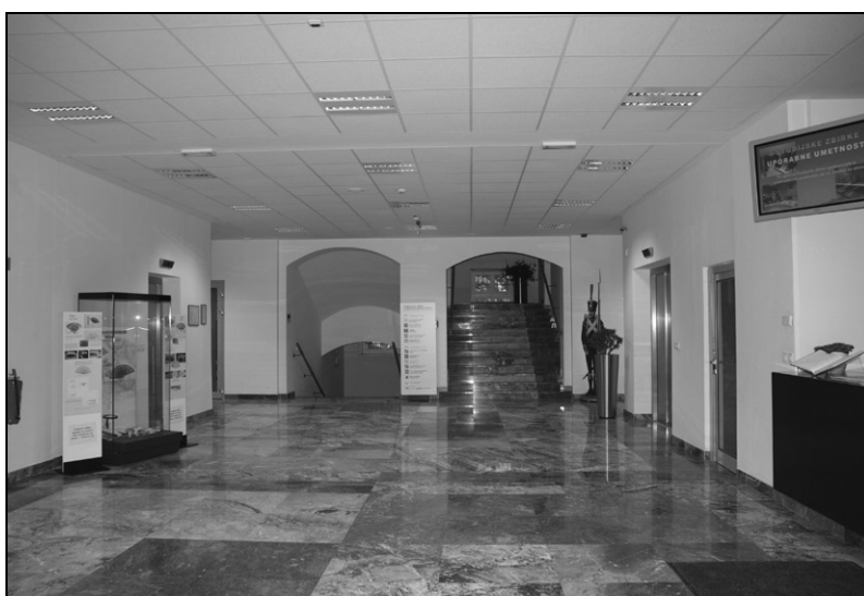
Vhodna avla.

Končno so naši bogati fondi kot nenadomestljiv primarni vir neposredno dosegljivi tudi vam, vsem kolegom zgodovinarjem. Življenje v preteklosti lahko rekonstruiramo ne samo iz pisnih, slikovnih in ustnih virov, ampak tudi materialnih. Poleg arhitekturnih lupin, hiš, so to prav njihovi nekdanji inventarji – množica vsakdanjih in manj vsakdanjih predmetov. Tridimenzionalni predmeti, avtentične priče nekega časa in prostora, so pogosto že znani, ker so povezani z eminentnimi osebnostmi, slovenskimi ustvarjalci, umetniki, politiki, gospodarstveniki. Včasih predmete razumemo simbolno, v zvezi s pomembnim zgodovinskim dogodkom, obdobjem ali krajem. A to je le ena dimenzija.