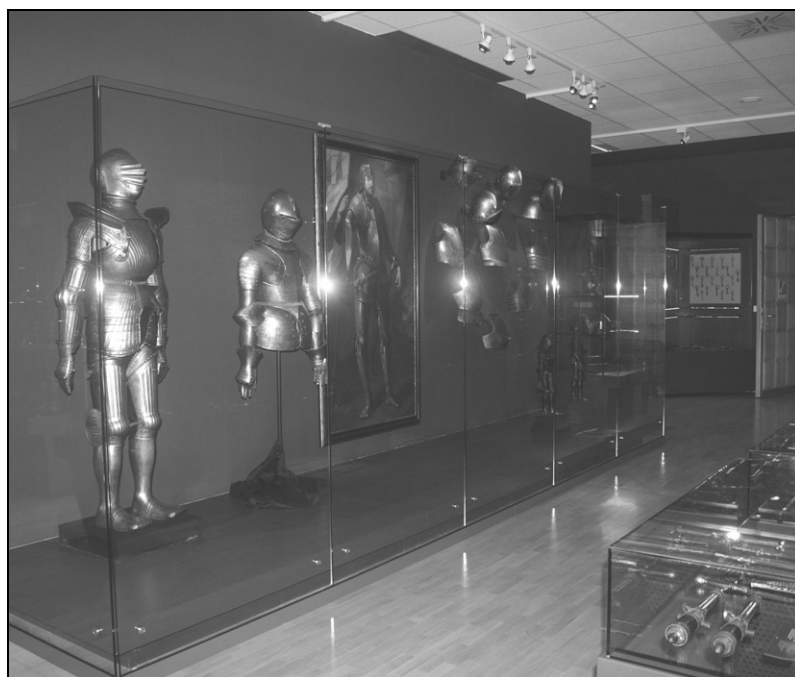
Študijska zbirka orožja.