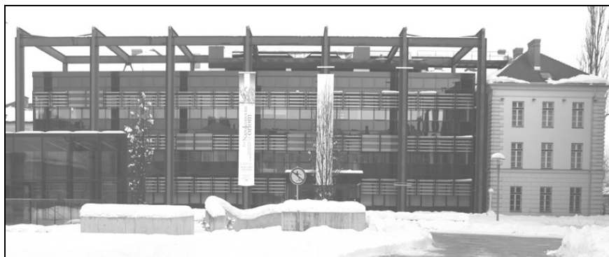
Stavba NMS z dvorišča od Metelkove ulice (foto: Maja Lozar Štamcar (NMS)).