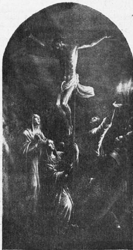
Bassano - Križanje

Knjižica je pravi biser najglobljeja pojmovanja življenja v Mariji. Grinjonova pobožnost je v bistvu integralen del marij. kongregacij: posvetitev Mariji. Vse, kar imam