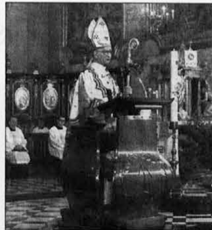
Nadškof dr. Alojzij Šuštar je daroval sv. mašo za domovino

Žalostno je dejstvo, da 50 let po vojni Slovenci nismo sposobni spraviti; še bolj žalostno pa je, da se srd in sovraštvo prenašata iz roda v rod, namesto da bi Slovenci skupno gradili svoj novi dom, svojo mlado državo. Tako ena kot druga stran sta še preveč zakrknjeni v lastni prav, da si ne moreta blizu in to je za ves slovenski narod zelo slabo. Mimo tega dejstva ni mogel niti ljubljanski nadškof dr. Alojzij Šuštar, ko je v nedeljo v ljubljanski stolnici daroval slovesno sveto mašo za domovino. Bila je dejansko največje dejanje slovenskega praznovanja konca druge vojne, saj je bila za vse Slovence; namenjena je bila vsem brez razlike: tistim, ki so že umrli, tistim, ki smo še tu, in vsem tistim Slovincem, ki raztreseni živimo po vsem svetu. Mir, ljubezen in sprava, to so bile glavne teme te slovesne maše. Nadškof je poudaril pomembnost sprave, ki se je v teh dneh po Evropi povsod zavedajo, in se obenem ozrl na Slovenijo, kjer se sovraštvo danes še poglablja. Nadškof Šuštar je dejal, da je dolžnost kristjanov sprava, kar pomeni »priznanje krivde, odpuščanje in prošnja za odpuščanje«. Obenem je vse vernike pozval, naj molijo za svojo domovino in za ljudi na vodilnih mestih; pono-