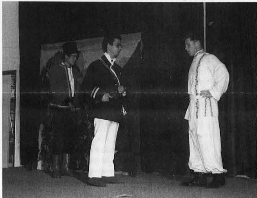
Prizor s sobotne predstave