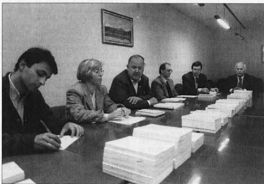
S petkove tiskovne konference