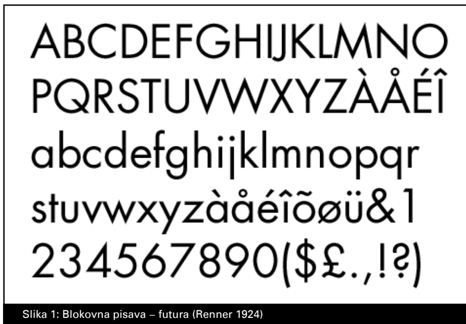
Slika 1: Blokovna pisava – futura (Renner 1924)