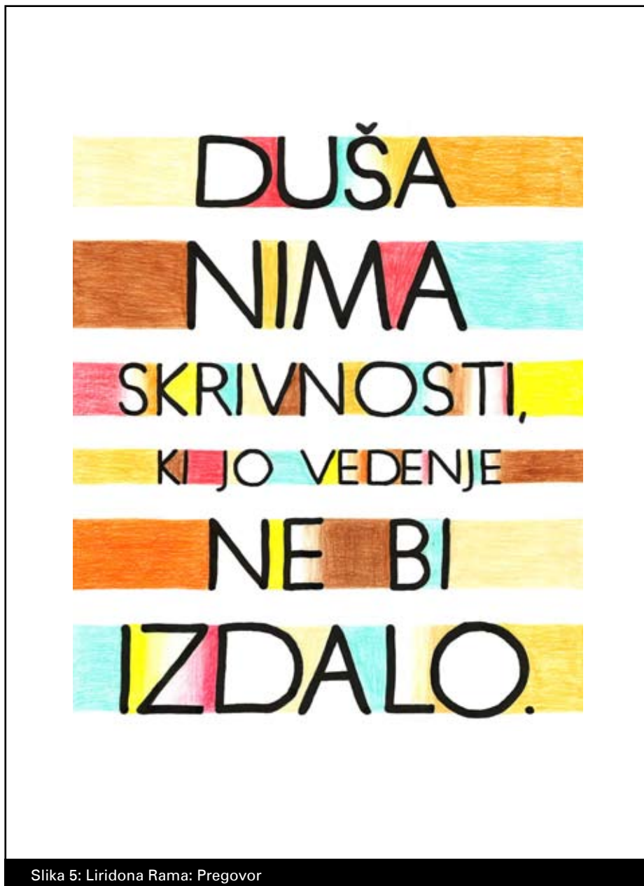
Slika 5: Liridona Rama: Pregovor

Oblikovanje besedila z blokovno pisavo v povezavi z barvno kompozicijo se je izkazala za zelo kompleksno likovno delo. Z oblikovanjem osnutka, določanjem sorazmerij črk in preračunavanjem dimenzij besedila so dijaki