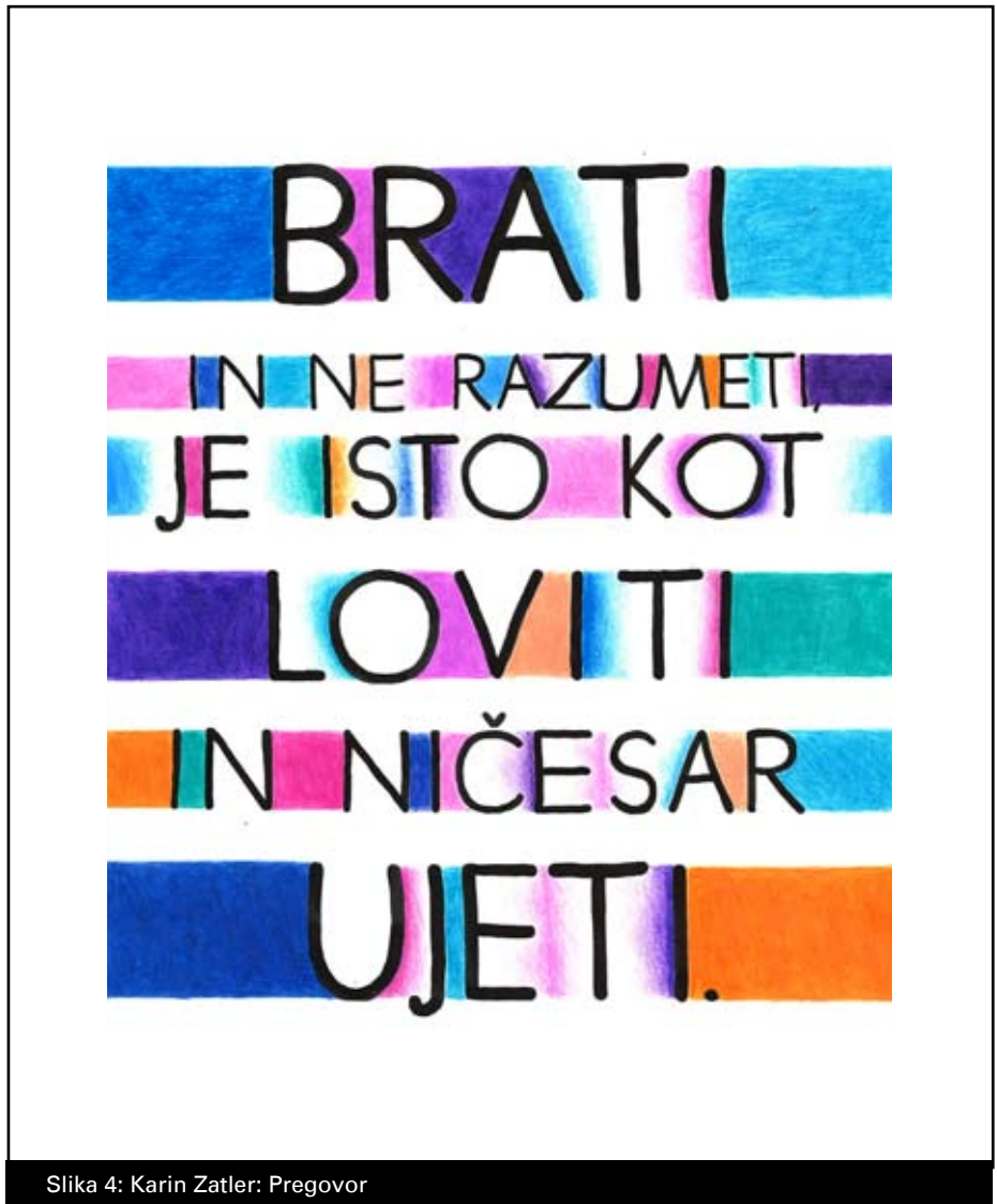
Slika 4: Karin Zatler: Pregovor

Sorazmerje oziroma proporcijski pojem, s katerim označujemo medsebojna razmerja delov neke celote (Šuštaršič 2004: 292–294). Vsako oblikovanje črke oziroma pisave temelji na poznavanju in razumevanju merskega sorazmerja, saj ima vsaka črka svoja notranja