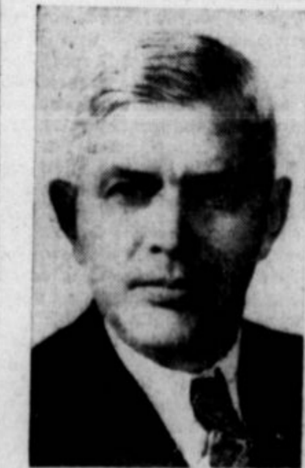
CHARLES E. WILSON načelnik zveznega mobilizacijskega urada in predsednik močnega korporacije General Motors.