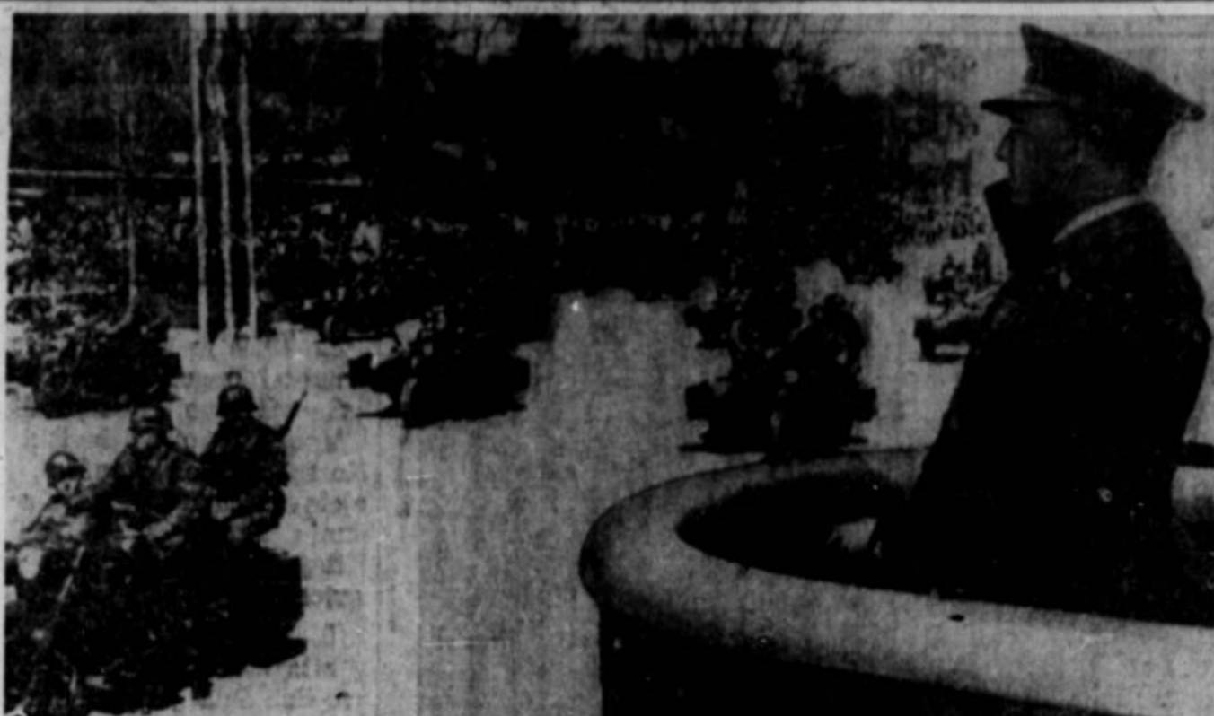
Na sliki je španski diktator Francisco Franco, ki je ob priliki 12. obletnice njegove diktature nad španskim ljudstvom opazoval vojaško paradu, ki je bila prirejena njemu v čast. Svečanosti se je udeležilo 19 poslanikov tujih držav, med temi tudi ameriški, francoski in angleški poslanik.

Ako ste prejeli poseben zavoj te številke, prosimo vas, da jo razdelite med rojake in priporočite jim, da naj se naroče na Proletarca.