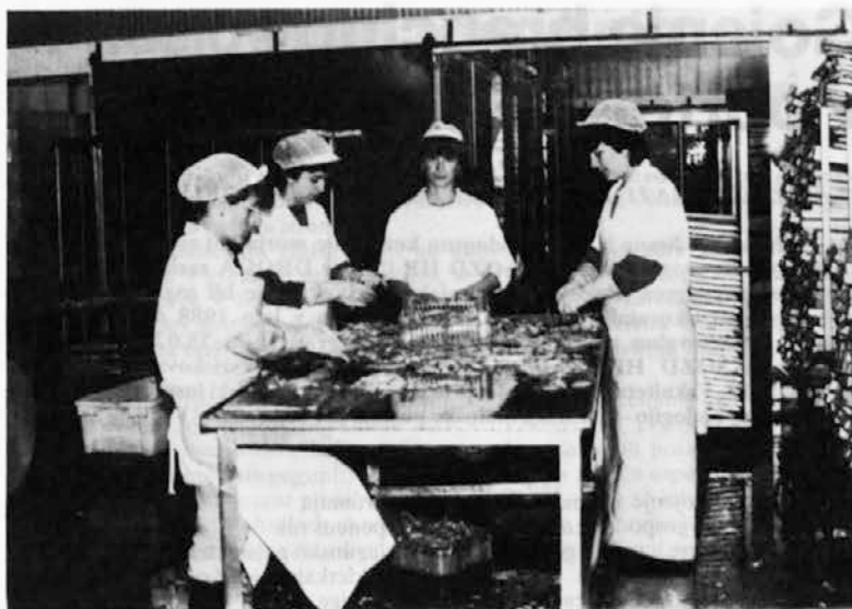
Prestrukturiranje, ki ga predpostavlja zadnji sanacijski program, pomeni preusmeritev proizvodnje na izdelke višjega dohodkovnega razreda v obliki konfekcionirane polpripravljene ribe.

manjkljivosti, ki jih v vseh letih nismo uspeli odpraviti.