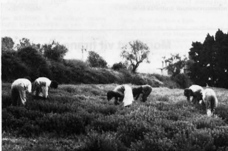
COŠ v Kortah — poskusno gojenje origana