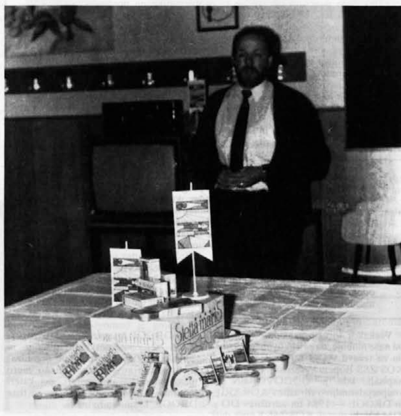
Predstavitve programa Stella maris