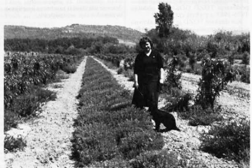
Gojenje origana v Škodelinih

Tehnologija pridelovanja je pri različnih kulturah različna. Pri nekaterih je moč večino del opraviti z običajno kmetijsko mehanizacijo, druge pa zahtevajo več ročnega dela. Tako nekateri kooperanti pridelujejo zdravilne in aromatične rastline že na nekajhektarskih površinah, drugi pa na nekaj sto kvadratnih metrih. Tehnologija pridelovanja obsega, kot pri vseh drugih kultiviranih rastlinah, pravilno pripravo zmlje, gnojenja tal, nego in zaščito rastlin, spravljanje pridelka ter sušenje, ki je še zlasti pomemben del pridelave. Do DROGA še nima ustreznih sušilnic zelišč, zato kooperanti sami sušijo zelišča v naravnih pogojih in dostavljajo drogo, kljub temu, odlične kakovosti.