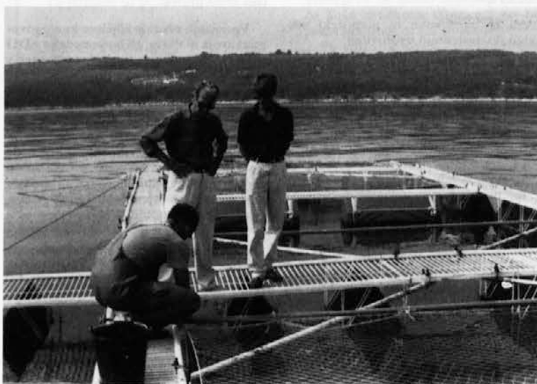
Strokovni ogled gojišča brancinov