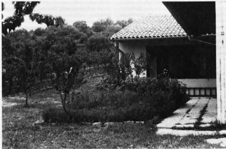
COŠ v Kortah

zemljišču celodnevne OŠ v Kortah. Pričeli smo z gojenjem 20 vrst zelišč. Namen prvih poskusov je bil ugotoviti, katera zelišča uspejajo na tem področju in kako. Ko so bili prvi poskusi za nami, smo se povezali s kmeti kooperanti, ki so bili pripravljene sodelovati pri poskusch