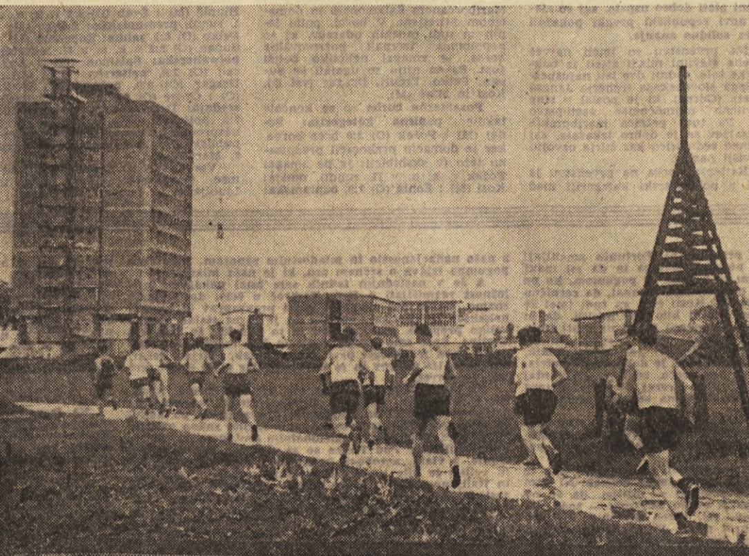
Posnetek prikazuje moške ekipe takoj po startu na 25 km

Partija Benkö - Geller je prekinjena v izenačenih pozicijah, medtem ko sta Petrosjan in dr. Filip remizirala že v 14. potezi. Po VII. kolu, s čimer je tudi končan prvi del turnirja, je vrstni red naslednji: Korčnoj in Keres po 4 (1), Petrosjan 4, Geler 3,5 (1) itd.