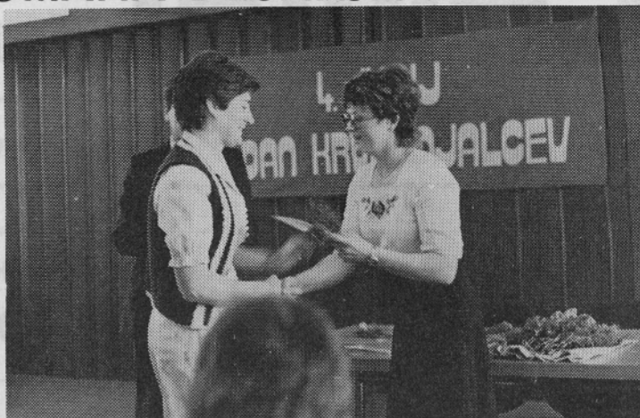
Priznanje za darovano kri, ki je nekemu rešila življenje.