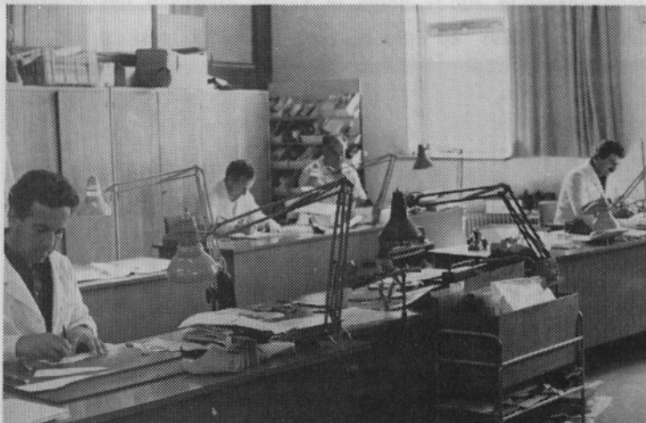
Nagrajenci na svojih delovnih mestih v modelirnici.

Nagrajencem čestitamo in želimo še veliko uspešnih modelov. Tudi taka tekmovanja in nagrade pripomorejo k renomeju delovne organizacije.