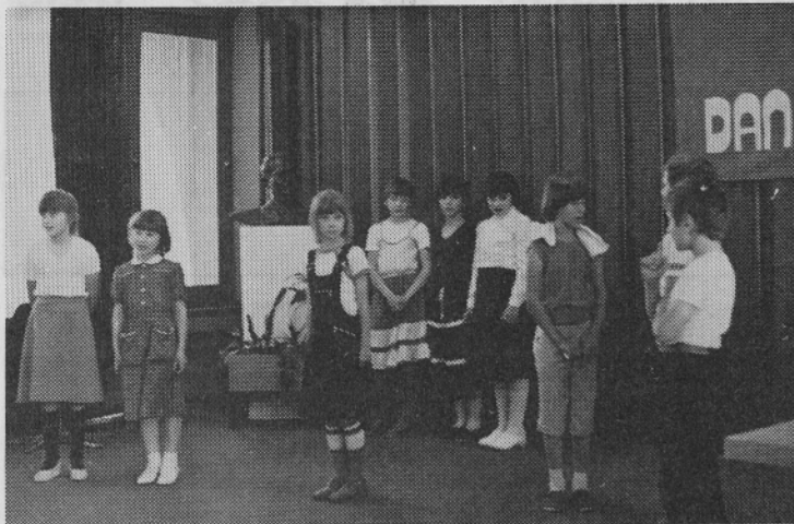
Učenci krvodajalcem Peka.

V petek 4. junija, ob prazniku krvodajalcev je bila v dvorani upravne stavbe skromna proslava. Krvodajalcem so bila podeljena priznanja za 5, 10, 15 in 20 krat darovano kri. Priznanja je dobilo 38 naših delavcev. Proslavo so popestrili učenci osnovne šole iz Loma. Škoda je le, da je bil obisk več kot skromen.