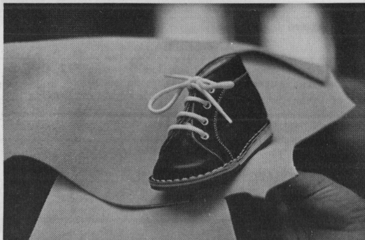
Nagrajeni model otroškega čevlja