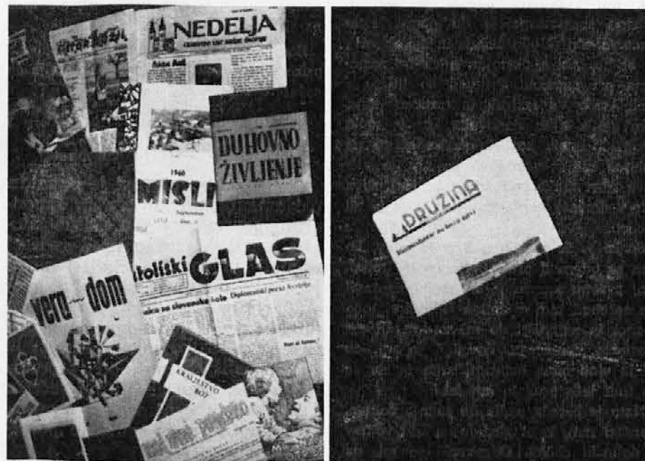
Svoboda tiska med Slovenci: peščica Slovencev v zamejstvu in v izseljenstvu bere liste in revije na levi strani, za vse Slovence v domovini pa sameva sredi globoke teme skromna Družina. Tako je slovenske katoličane osvobodil komunizem, ki označja vsem — svobodo in enakopravnost.

Senat je dne 25. novembra odobril zakon o obveznem zavarovanju trgovcev. Tako bo sedaj zelo velika kategorija poslovnih ljudi deležna zavarovanja v slučaju bolezni in za starost.