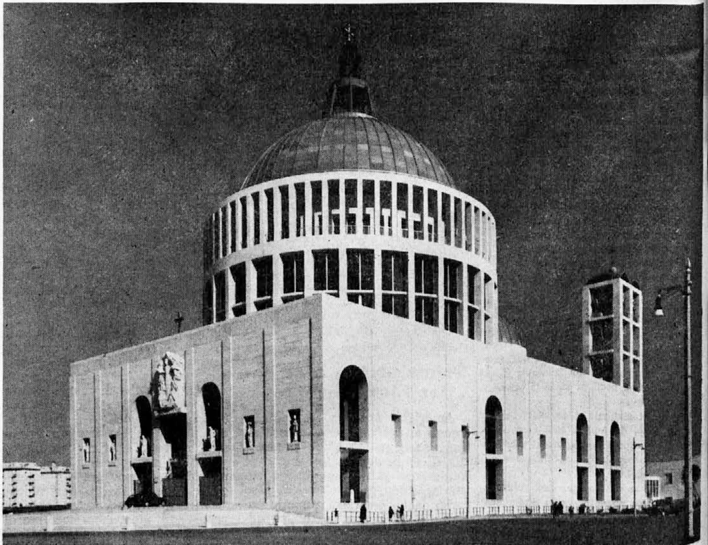
Veličastna moderna bazilika sv. Janeza Boska v Rimu

Nova cerkev ima izredno lepo lego sredi modernega rimskega predmestja. Ob novi cerkvi je postavljen moderni salezijanski zavod. Z glavnega kolodvora v Rimu se pripelje do te cerkve s cestno železnico za »Cinecittà«.