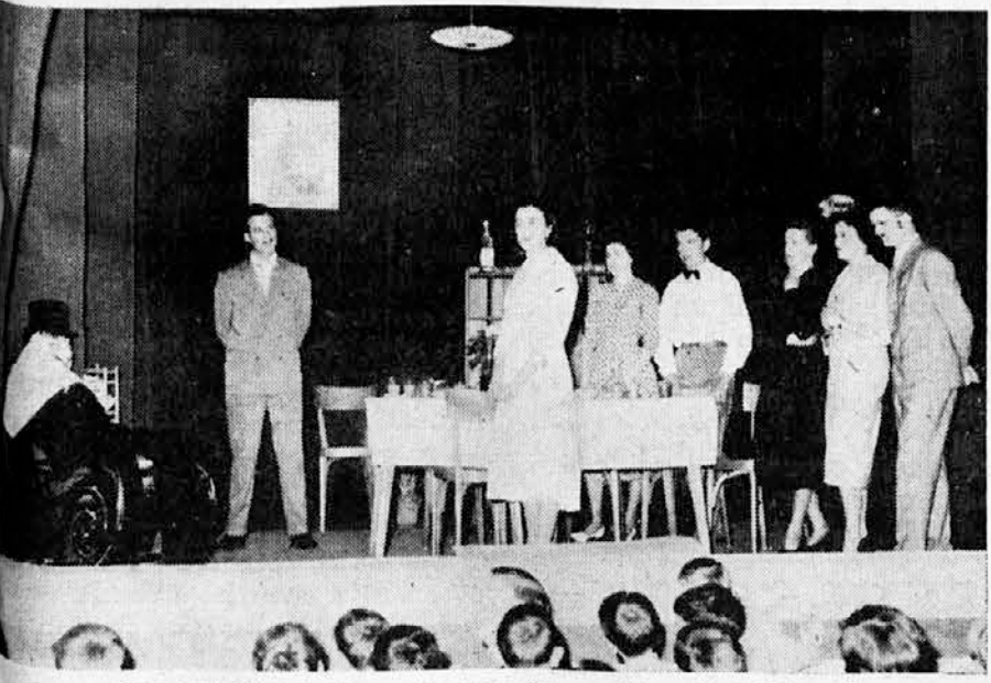
Bazoviški Oder je 26. aprila uprizoril veseligo Poslednji mož

V celi družbi izstopajo štiri glavne osebe: štiriindvajsetletna Clo, ki daje na razpolago svoje stanovanje in celo spalnico svojim staršev, ker, »vsak dan, ki ga uživamo v popolni čuti prostosti, je pridobljen dan za življenje, ki nas čaka.« Njena najboljša prijateljica je Mic, kateri ugajajo »iste plošče, isti lokali in isti fantje« kot Clo. Zapustila je učiteljišče, ker se ji je zdelo neumno truditi se, da potem druge uči to, čemur sama več ne verjame. Njena mati in njen brat, ki delata, ji gresta na živce, zato živi sama v najeti sobi. Alain je tudi zapustil šolo, zato mu je oče odredel vsako pomoč. Tudi on ne verjame več ničemu, kajti delo »kvari človeka in mu samo pripomore k večji lakoti. Uživati je treba čim-