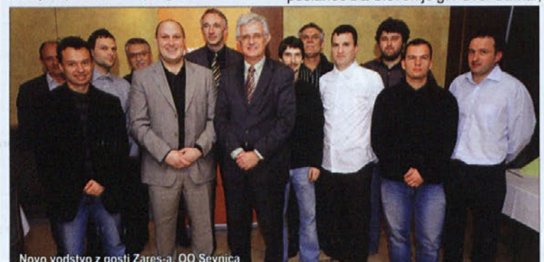
Novo vodstvo z gosti Zares-a, OO Sevnica