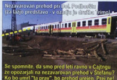
Nezavarovan prehod pri Del. Podborštu (za lažjo predstavo - v ozadju je družba Trimo)