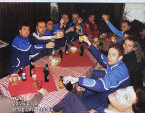
Zdravica ob zmagi pri Botričku.

7 ŽELJ VSAKEGA DOLENJCA: 1. Da bi imel vinograd z 1.500 trtami; 2. Da bi v vinogradu bila zidanica polna sodov vina; 3. Da bi imel lepo ženo kot je Urška od Janeza Janše; 4. Da bi imel "ablast" kot Janez Janša; 5. Da bi imel dober avto kot Akrapovič; 6. Da bi znal igrati na harmoniko kot Lojze Slak; 7. Da bi izdal toliko CD-jev, kot je ata partizanov. (Vir: internet)