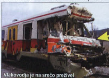
Vlakovodja je na srečo preživel

V ponedeljek, 18.2. nekaj po 8. uri je v kraju Zidani most pri Štefanu na nezavarovanem prehodu ceste čez železniško progo prišlo do prometne nesreče, v kateri je voznik tovornega vozila zapeljal na železniško progo v trenutku, ko je iz smeri Trebnjega pripeljal potniški vlak. V nesreči ni nihče utrpel te-