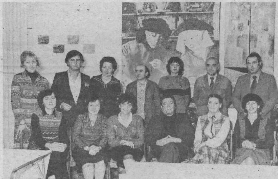
Mešani pevski zbor Ljubljanske banke v manjši zasedbi