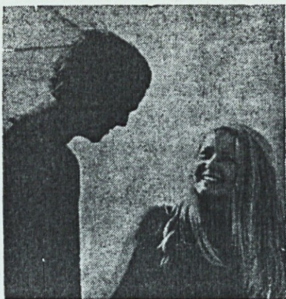
Alozij Suštar, ljubljanski nadškof