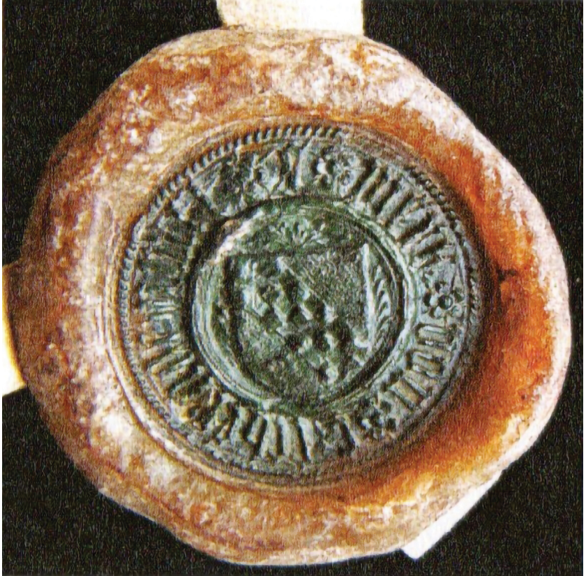
Pečat Martina Črnomaljskega, vicedoma na Kranjskem, iz listine z dne 7. novembra 1436. Bizjak in Preinfalk 2009, 654.