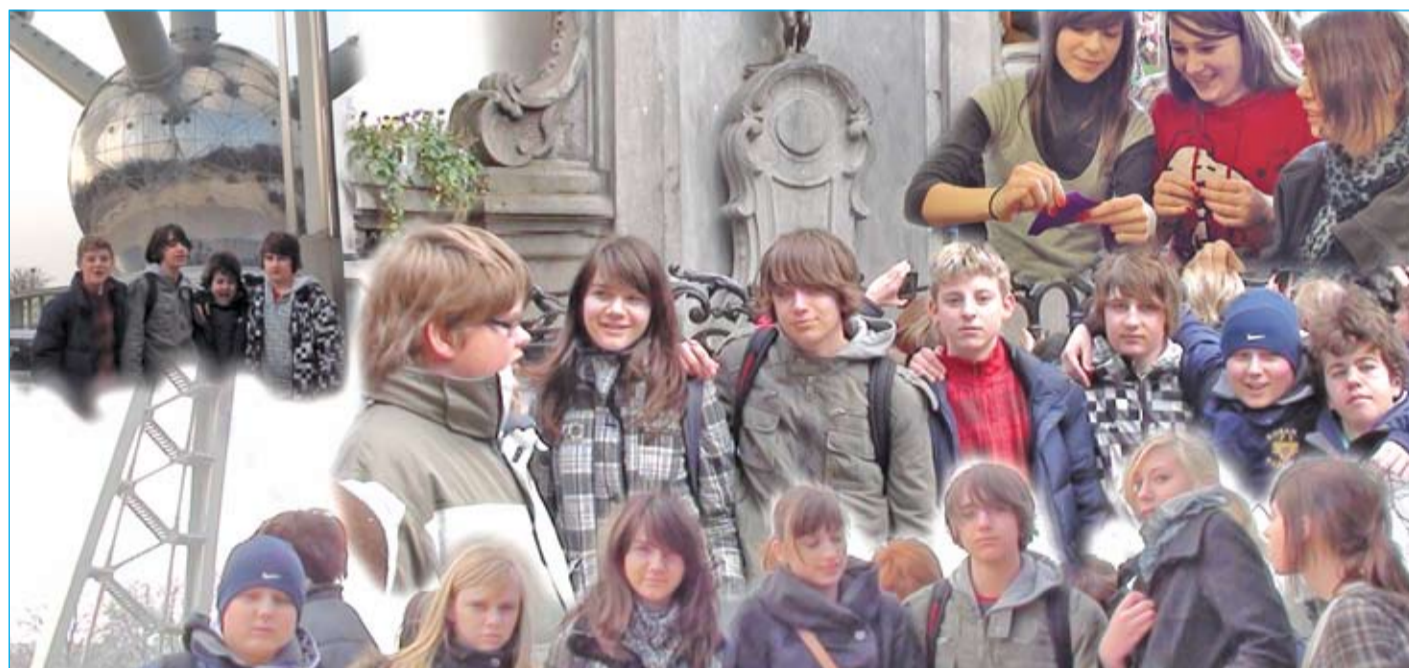
Znameniti Atomiumum (levo zgoraj), pred znamenitim Dečkom, ki lula, ter izdelovanje rož za duhe (desno zgoraj)

Zaključila bi z ugotovitvijo, ki so jo zapeli naši otroci, ko smo v petek zvečer okrog polnoči zagledali slovensko mejo: »Slovenija, od kod lepote tvoje ...«. Na