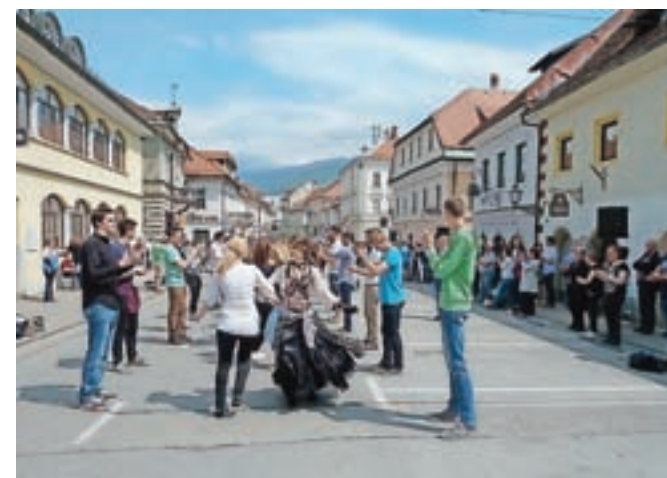
Kamniški maturantje so tudi letos na Glavnem trgu zaplesali četvorko.

Približno sto osemdeset maturantov Gimnazije in srednje šole Rudolfa Maistra se je pred maturo sprostilo s plesom v središču mesta.