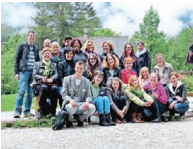
Nova generacija turističnih vodnikov občine Kamnik skupaj z izpitniki

Kamnik – Kamnik si vsako leto ogleda veliko domačih in tujih turistov. Marsikdo si želi mesto in okolico spoznati ob pomoči lokalnega turističnega vodnika, saj tako odkrije skrite koticke in spozna lokalne posebnosti. Da bi lahko obiskovalcem naše občine ponudili še več, je Zavod za turizem in šport v občini Kamnik po treh letih pripravil tečaj za nove turistične vodnike. Na tečaj, ki je zajemal tako teoretični kot praktični del, se je prijavilo veliko kandidatov. V teoretičnem delu so poslušali