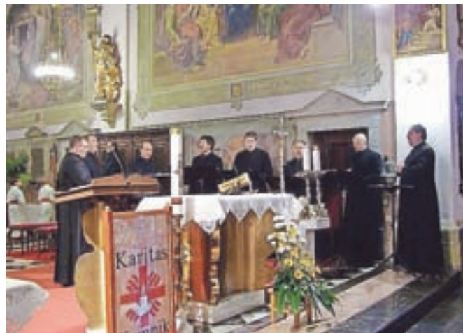
Obletnico smo praznovali z mašo, pri kateri je pel oktet Oremus, ki ga sestavljajo duhovniki.