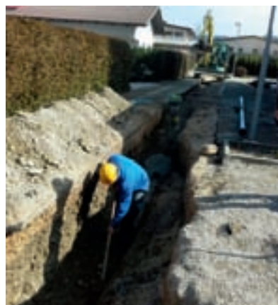
Izgradnja vodovoda na Pibernikovi ulici.

Zaradi del so marsikje potrebne občasne (delne) zapore cestniš. Že nekaj časa dela v zvezi z vodooskrbo potekajo predvsem na regionalni cesti Kamnik-Ločica, kjer se polaga cevovod premera DN 150. Odseki regionalne ceste, kjer potekajo dela, se počasi, a vztrajno pomikajo v smeri proti Šmartnemu v Tuhinju - trenutno predvsem na območju Soteske. Hkrati poteka urejanje kmetijskih površin na odsekih, kjer je gradnja že zaključena. Gradbeni dela, med drugim, še vedno potekajo na območju Lok in Šmartnega v Tuhinju. Na območju Arboretuma Volčji Potok je bila, hkrati z zagotovitvijo ustreznega vodovodnega sistema, izvedena tudi sanacija ceste z dograditvijo pločnika, kar bo pomembno pripomoglo k večji varnosti prometa na tem območju.