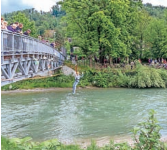
Na letošnjem Perovanju je najbolj navdušila perovsko-tirolska žičnica, ki je tudi simbolno povezala oba perovska bregova.

Sobotno sončno popoldne se je začelo obetavno in dalo organizatorjem dovolj časa, da pripravijo vse potrebno za pripravo prizorišča – levi in desni breg Kamniške Bistrice. Ob povezovalnem mostu je bilo nad vse živahno. Ulični telovadci so se potili na svojem poligonu, številni so poskušali perovske dobrote, drugi meditirali ob ustvarjanju mandal na delavnici dijakinj GSŠRM, a daleč največ navdušenja je zagotovo požela perovsko-tirolska žični-