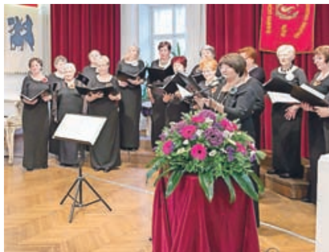
Ženski zbor DKD Solidarnost s pesmijo vstopa v peto desetletje.

Kamnik – V petek, 30. maja, so v dvorani nad kavarno Veronika kamniške »Solidarke« zapele številni zvesti publikli in s slavnostnim koncertom zaključile 40-letni jubilej skupnega druženja ob pesmi. Ženski del DKD Solidarnost Kamnik že od nekdaj zatrjuje, da je z veselo pesmijo družba prijetejša in življenje lahkotnejše. Pod vodstvom zborovodje Marka Tirana je osemnajst pevka predstavilo trinajst skladb, večinoma slovenskih ljudskih pesmi, ki jih najraje prepevajo in uvrščajo v svoj program.