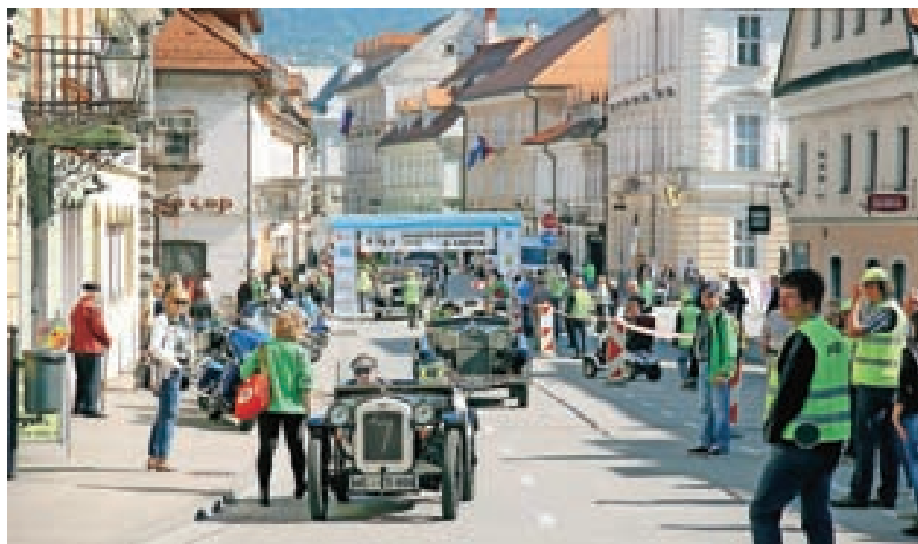
Mednarodna revija starodobnikov v organizaciji Društva starodobnih vozil Kamnik je bila prava paša za oči.

Med lastniki starodobnih vozil je bilo nekaj Slovencev, po Vrhovnikovih besedah pa večina prihaja iz devetih drugih evropskih držav. Skupno se je v Kamniku zbralo okoli osemdeset vozil, ki so krenila na krožno pot po Gorenjskem. Glavni koloni motorjev in avtomobilov je spremljala tudi kolona nekoliko »mlajših« motorjev znamk Harley Davidson in Cadillac, v katerih so se popeljali predstavniki občin, sponzorji in drugi visoki gostje.