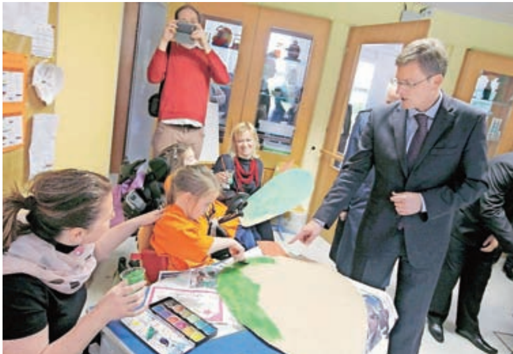
Predsednik vlade Miro Cerar ob obisku zavoda Cirius