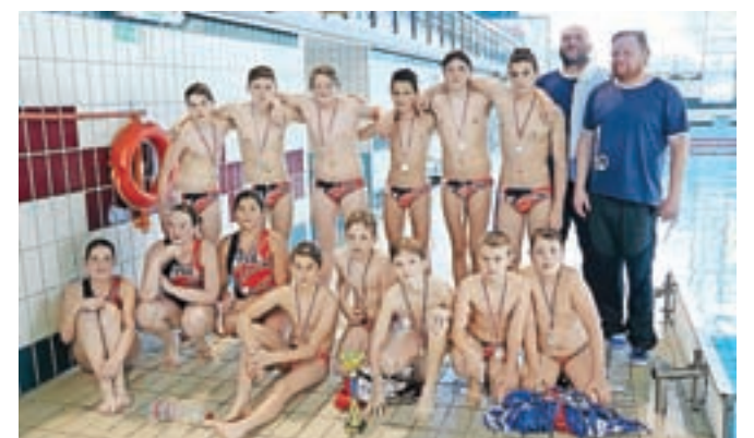
Mladi kamniški vaterpolisti so bili drugi na državnem prvenstvu.

V Kranju je bil v nedeljo, 22. maja, zaključek državnega prvenstva do 15 let. Ekipa Vaterpolskega društva Kamnik je v polfinalu visoko premagala Branik iz Maribora, v finalu pa so fantje in dekleta izgubili z AVK Triglav iz Kranja in osvojili končno drugo mesto v državi.