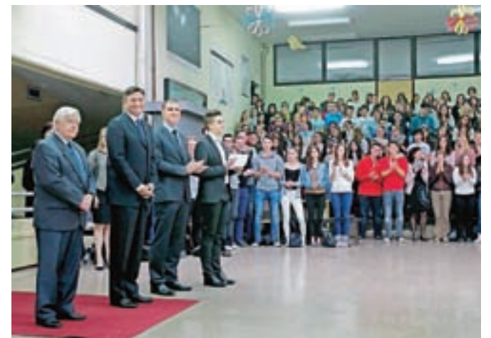
Milan Kučan in Borut Pahor sta svoja spoznanja in poglede delila z dijaki Gimnazije in srednje šole Rudolfa Maistra Kamnik.