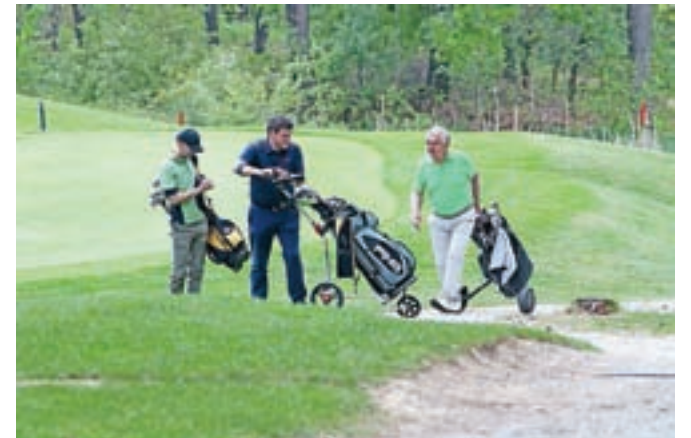
Golf Arboretum je simpatično in razgibano igrišče, ki se včasih spremeni tudi v igrišče za sladokusce.