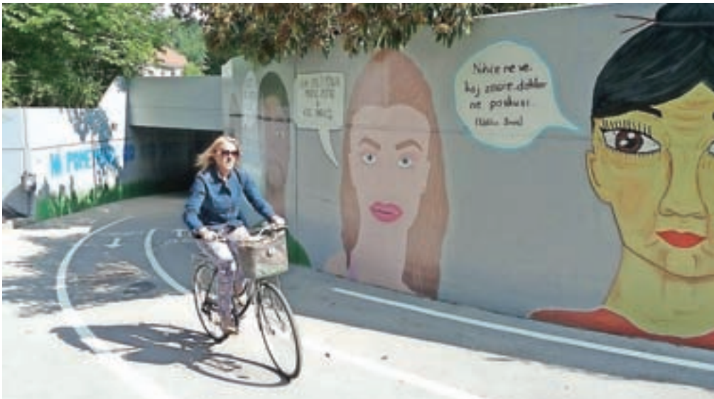
Podhod na Šolski ulici je na novo porisan in urejen, s tem pa za uporabnike še bolj varen in prijazen.

sarje in pešce v podhod zdaj pospremi napis: »Ni pomembno, od kod prihajaš, pomembno je, kam si namenjen.« Da so z živobarvnimi podobami in povednimi mislimi lahko polepšali podhod, so na šoli hvaležni tudi podjetjema Helios in Jub, ki sta prispevala vse potrebne barve, tudi poseben premaz, s katerim so poslikave zaščitili pred morebitnimi vandali. Pri projektu je sodelovala tudi Občina Kamnik, ki je za ureditev podhoda in okolice namenila 17.700 evrov. Na novo so namreč uredili tudi stopnice in zarisali potek kolesarskih stez, da bo podhod še bolj varen za vse njegove uporabnike.