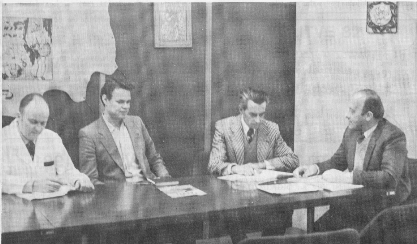
Kolektivni poslovodni organ