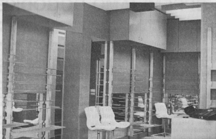
V poslovalnici Šibenik je zaključena adaptacija. Več o tem v prihodnji številki.

Oskrbovanci imajo v domu zdravstveno nego. Izvajajo jo medicinske sestre in negovalke, zaposleno imajo tudi fizioterapevko. V negovalni enoti je 6 medicinskih sester, 9 negovalk, fizioterapevka, 6 strežnic in čistilka.