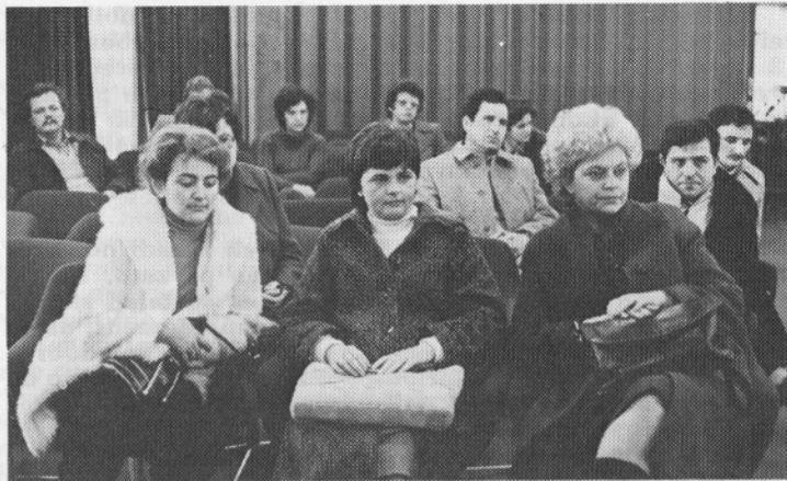
Skupina poslovodij v tovarni.