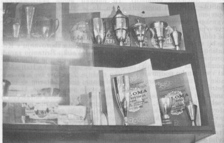
Športniki iz orodjarne si skoraj na vsaki tekmi pridobijo nov pokal.