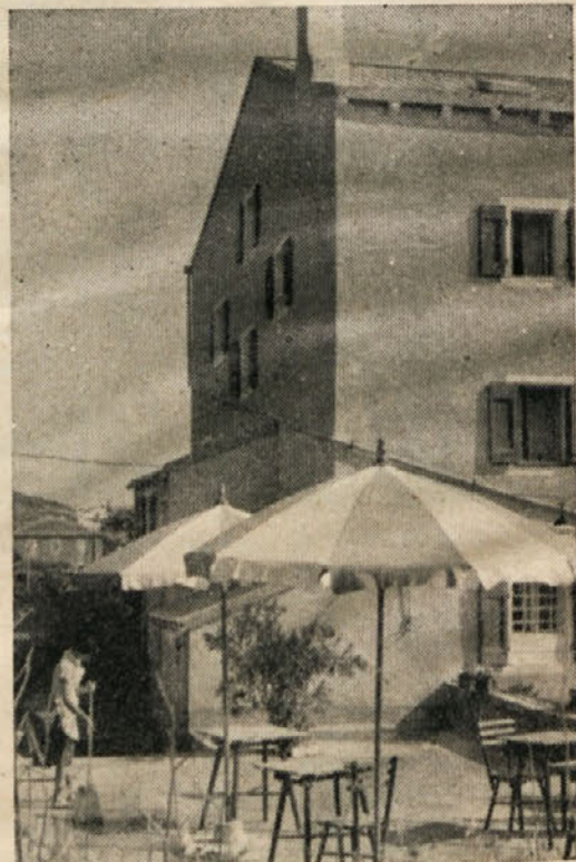
Terasa počitniškega doma v Nerezinah