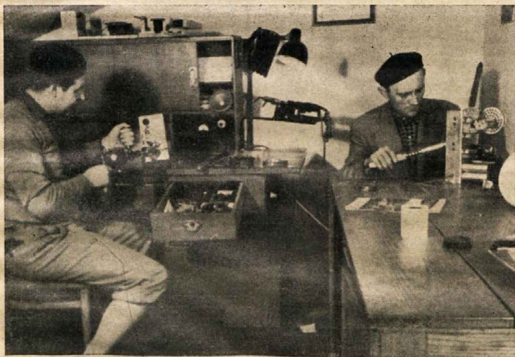
Radioamaterji Cinkarne pri delu

Na žalost ugotavljamo, da smo ravno vzgojo naših delavcev popolnoma zanemarili. Delno so temu krivi objektivni, v večji meri pa subjektivni faktorji. Če pomislimo, da nismo mogli »ali znali« organizirati niti varilnega ali strojnega tečaja za izpopolnjevanje naših že kvalificiranih kadrov. Se manj smo znali pridobiti ostale naše delavce k tehničnemu usposabljanju. K reševanju tega zelo perečega vprašanja bo društvo LT moralo čimprej pristopiti. V naših članih in ostalih delavcih moramo prebuditi interese do spoznavanja dela na posameznih delovnih mestih, procesov proizvodnje itd. Samo na ta način bomo v vsakem članu vzbudili čut odgovornosti, upoštevanja njegovega, naj bo še tako skromnega, deleža v skupnih naporih za dvig proizvodnje in olajšanja izredno težkega fizičnega dela v naših obratih.