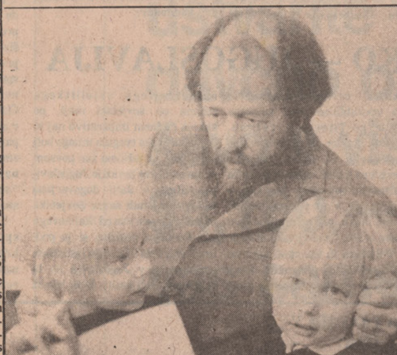
A.I. Solzhenitsyn: West unwilling to risk its comfort to confront Communism

Such propaganda is sheer madness and serves only to disarm the West. After the forces of Russian nationalism were betrayed by the West in the Russian civil war and once again in World War II, here is an open call to repeat this betrayal yet a third time. This would have ruinous consequences for the Russian people and for the other peoples of the USSR. It would be just as ruinous for the West. Today the Communist leadership with its