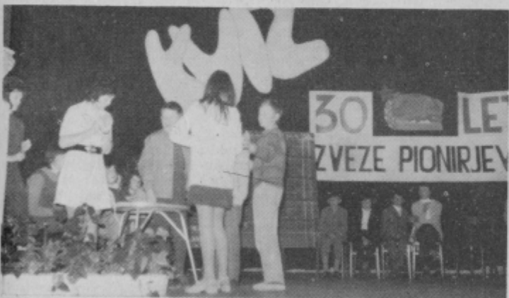
Za premislek je bila dana samo ena minuta. Za posamezne odgovore pa je bilo še to preveč

V okviru praznovanja 30-letnice Zveze pionirjev Jugoslavije so se že daljše obdobje na vseh osnovnih šolah občine Slov. Bistrica v različnih oblikah seznanjali s prehojeno potjo te organizacije in njeno vlogo danes.