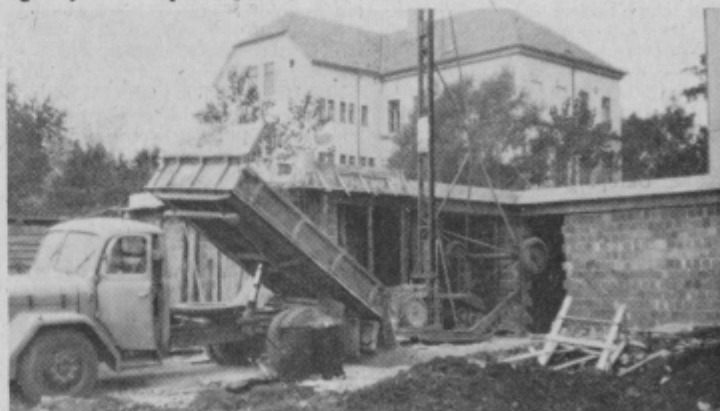
Toplarna ob koncu gradnje

da bo ogreval vse javne zgradbe v vzhodnem delu mesta. Gradnja toplarne bo veljala okoli 1.200.000