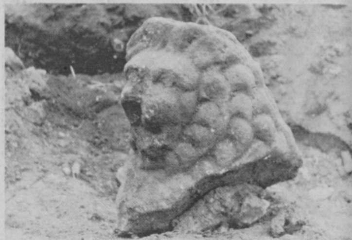
V času našega obiska na gradbišču nove ceste so izkopali glavo leva iz pohorskega marmorja.

Večkrat smo poročali, da je področje Hajdine silno bogato z arheološkimi najdbami, ker vedno, ko odstranijo vrhnje plasti zemlje, odkrijejo kakšne silno pomembne