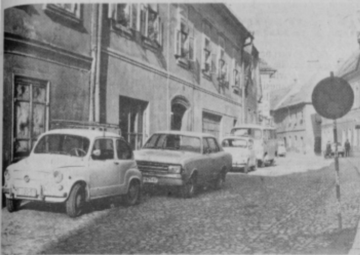
Pri gostilni „Ribič“ stoji prometni znak, ki prepoveduje parkiranje vozil v Vošnjakovi ulici. Malo naprej pa lahko vsak dan občudujemo številne avtomobile, ki jih tam puščajo zaposleni v tej in sosednjih ulicah. Zakaj ne bi odstranili tega prometnega znaka, če ga nihče ne upošteva? S. S.