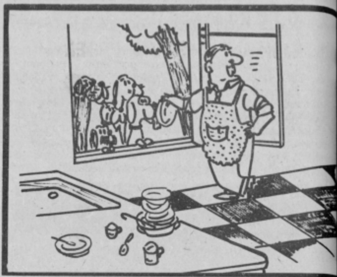
Samo še trenutek, draga, in posoda bo pomita.