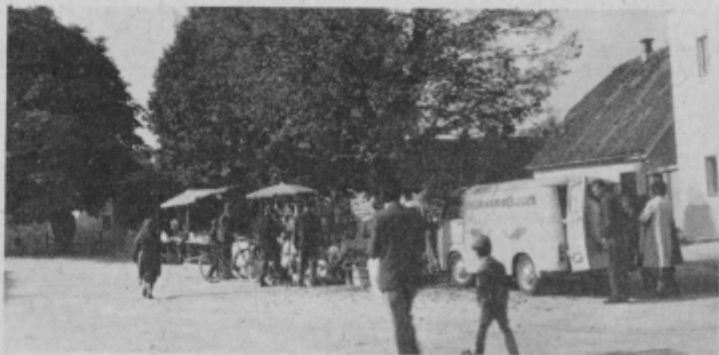
Takšna, čeravno samo časna rešitev, ne more biti ponos Slov. Bistrice. Pred sto in več leti so v hodu v naselja posevali posebno pozornost, v Slov. Bistrici pa ga označujemo s kramarstvom.

V Trgovišču, na cesti I. reda se je pripetila prometna nesreča med