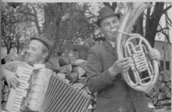
Od težkega dela okoreli prsti so postali gibčni, iz njunih grl pa je močče slišati pravo domačo pesem. Vivod in Založnik iz Malahorne pri Oplotnici.

pri Oplotnici že pridno vadita na svoje instrumente domače napeve, saj bosta tudi letos, kot že vrsto let nazaj, zabavala obiralce grozdja ob koncu njihovega dal. Tako se bo domača pesem slišala iz mnogih domačij, ko se bodo že utrujeni obiralci kljub težkemu delu na