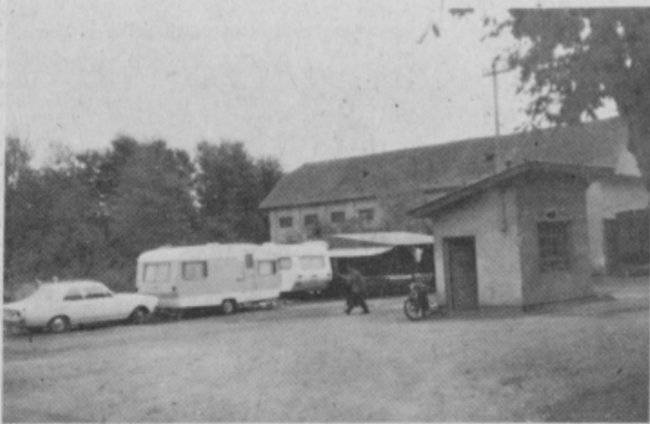
Še zadnjič služi ta prostor zabavi pa tudi tehtnici so dnevi šteti.

Pred okoli 20 leti so se prebivalci Slov. Bistrice odločili zgraditi dom kulture. Rečeno storjeno, toda že pri gradnji temeljev se je nekaj zataknilo in vse je obstalo. Vse do pred nedavnim je tako ostal prostor, namenjen kulturnemu domu, neizkoriščen, oziroma so na njem našli mesto odpadni avtomobili, največkrat pa tudi večjih kupov smeti nihče ni odstranjeval. Kolikor je še tam ostalo prostora, so ga od časa do časa zasedeli potujoči cirkusi.