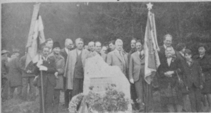
Spominski posnetek nekdanjih borcev NOB, udeležencev slavlja v Božjem, ob spomeniku padlega tovariša