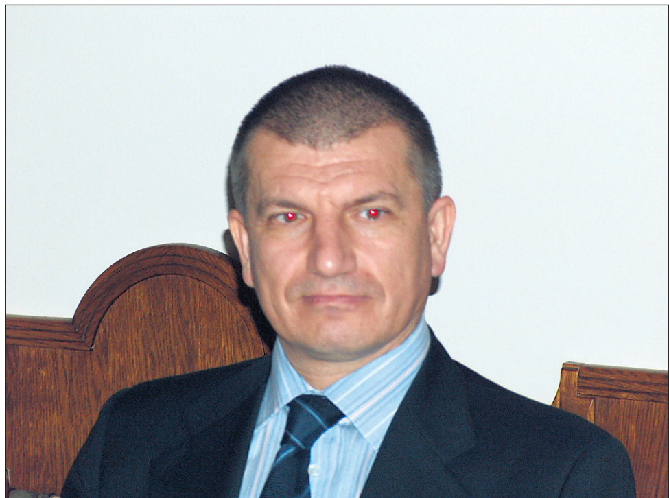
Minister za notranje zadeve Dragutin Mate: »Sem človek, ki želi vedeti vse podrobnosti in imeti čisto sliko o situaciji, pa četudi to stane dodatni čas za realizacijo določenih projektov!«