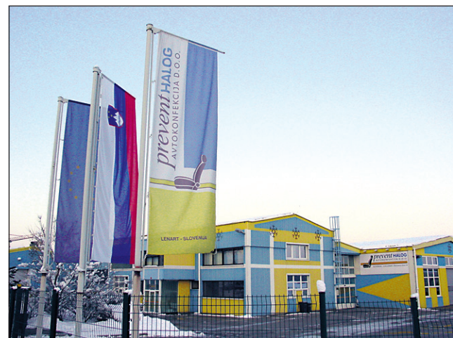
Podjetje Prevent Halog iz Lenarta zaposluje 657 ljudi.