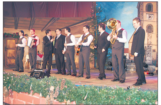
Slapovi so zapeli z Modrijani.