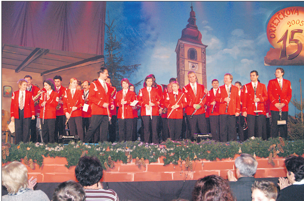
Na Orfejčkovem odru je nastopil celoten ptujski Pihalni orkester.