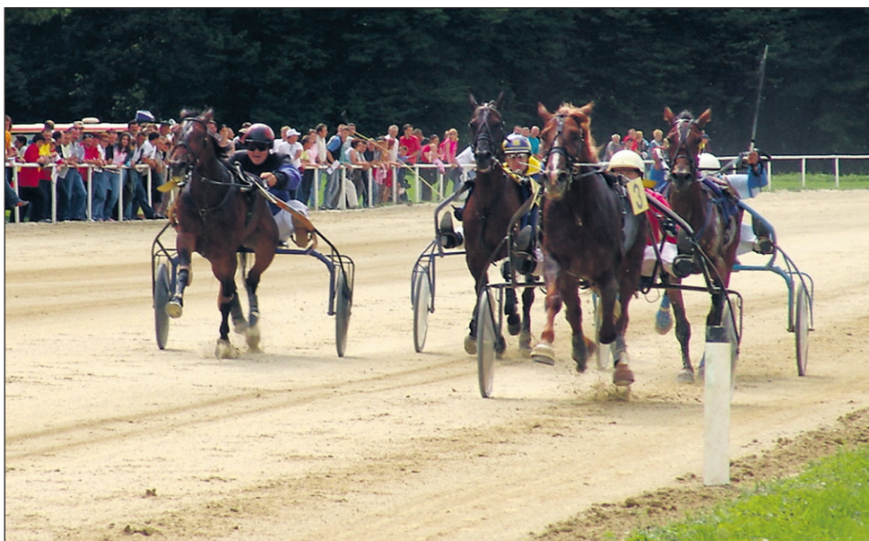
V okviru programa je tudi promocija ljutomerskega kasača – blagovne znamke Prlekije.