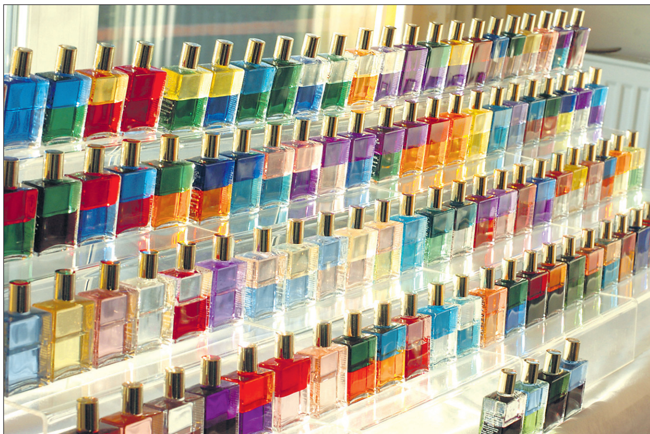
Equilibrium stekleničke so srce Aure-Some. Vsaka izmed trenutno 105 stekleničk ima svojo individualno barvno kombinacijo, poseben namen in sporočilo – inspiracijo za raziskovanje samega sebe in ključ do dobrega počutja.