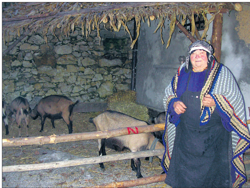
Utrinek iz živih jaslic