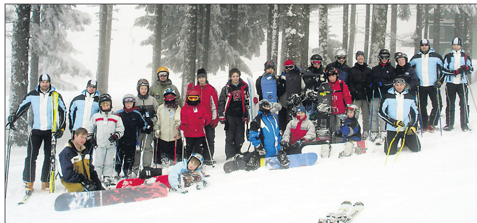
Udeleženci tečaja smučanja in bordanja