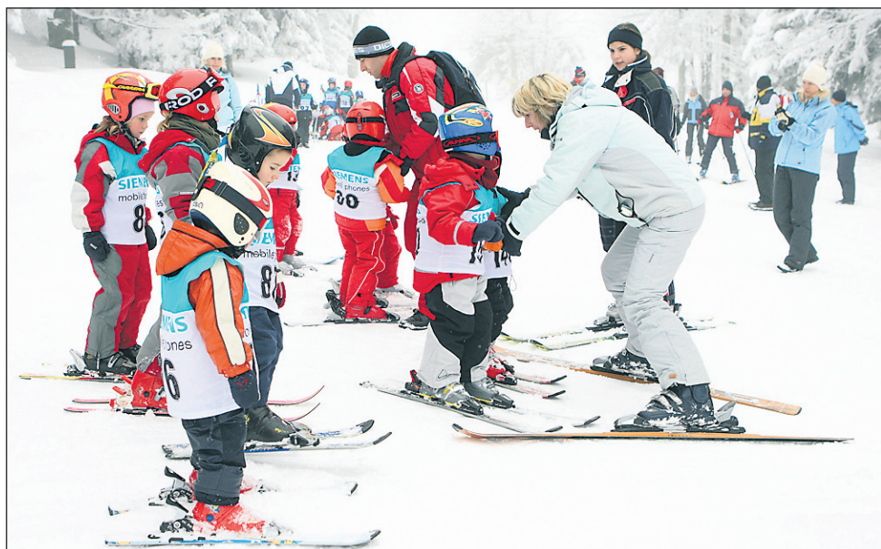
Za otroke je bilo na Pohorju dobro poskrbljeno.