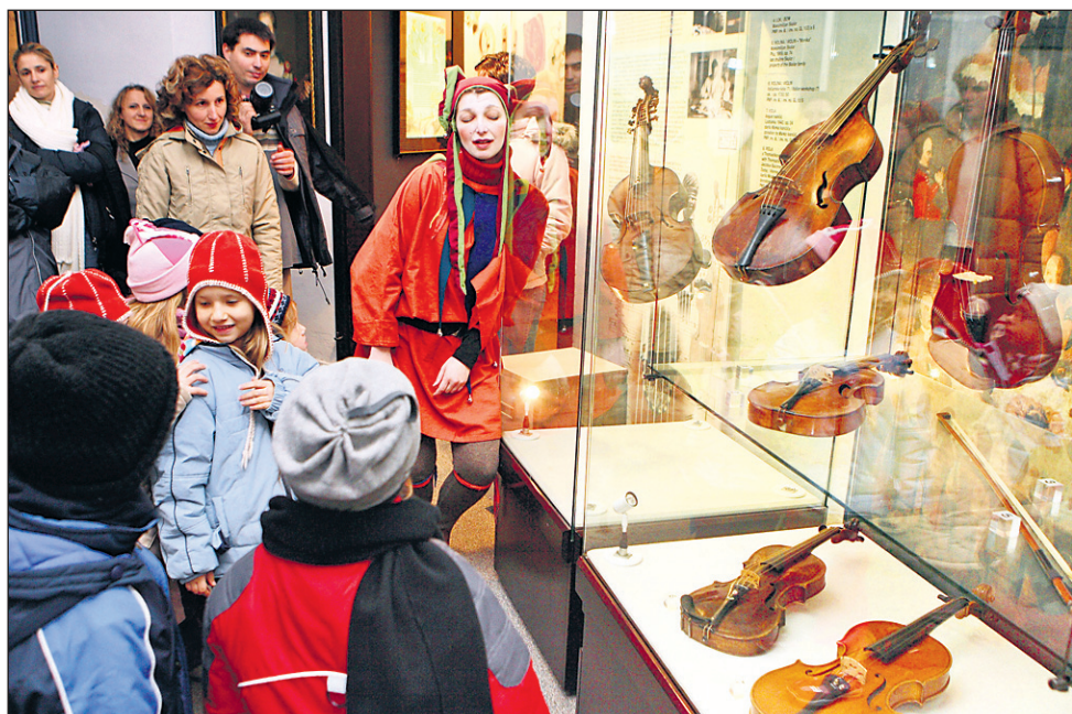
Letos je bil "glavni" norček Muzikalček, poln domislic in šegavih norčij.