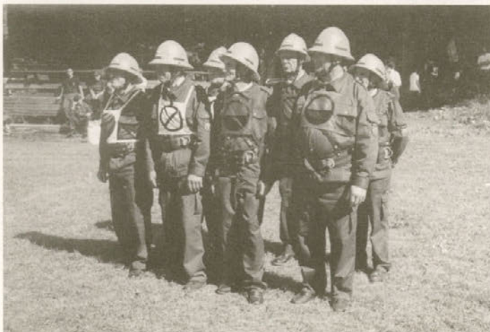
Veterani pred startom