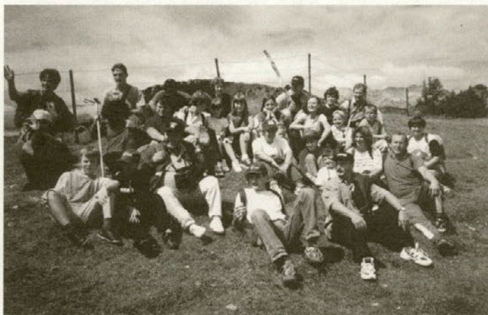
Na Veliki planini