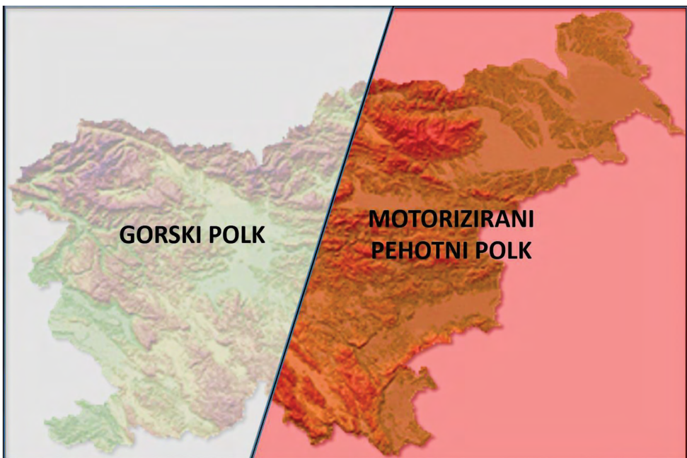
Figure 2: Proposal of a new approximate delineation of the area of responsibility