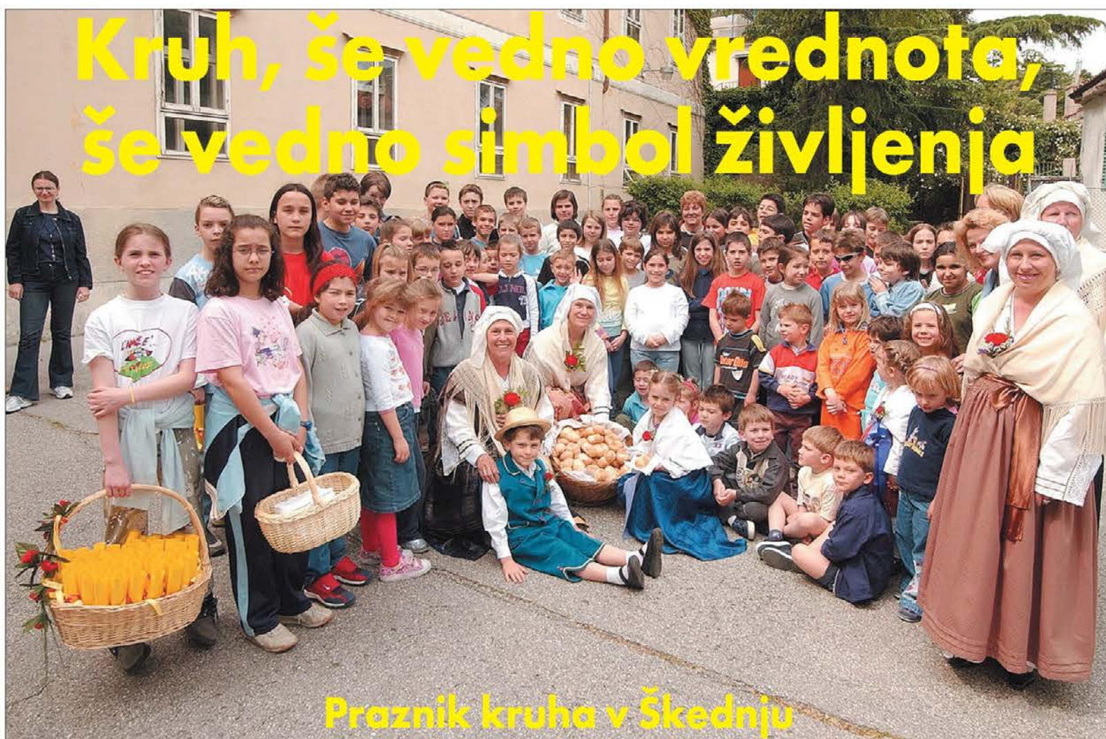
Praznik kruha v Škednju

Pomembno znamenje, ki bi pričalo o raznolikosti tukajšnjega prebivalstva, bi bile seveda večjezične table ob vhodu v mesta, npr. Gorizia, Gorica, Gurizze. Takšna večjezičnost je že dolgo uveljavljena na Koprskem, na Južnem Tirolskem in v Dolini Aoste. Kdo ve, če se bo to kdaj uresničilo tudi pri nas.