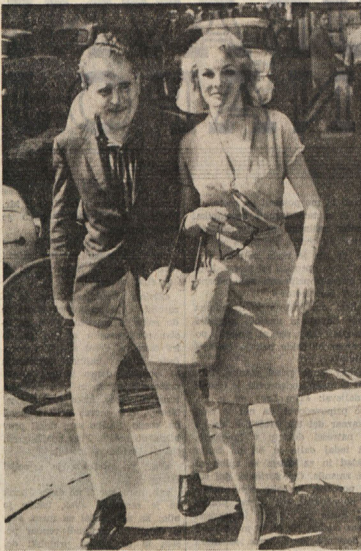
Carroll Baker z možem v Rimu