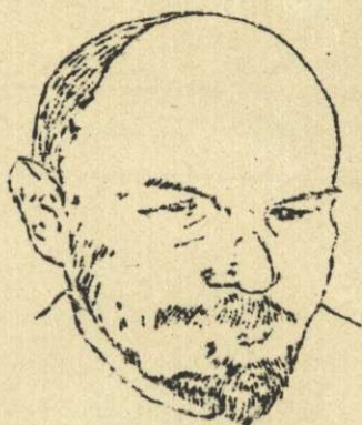
VLADIMIR ILIČ LENIN