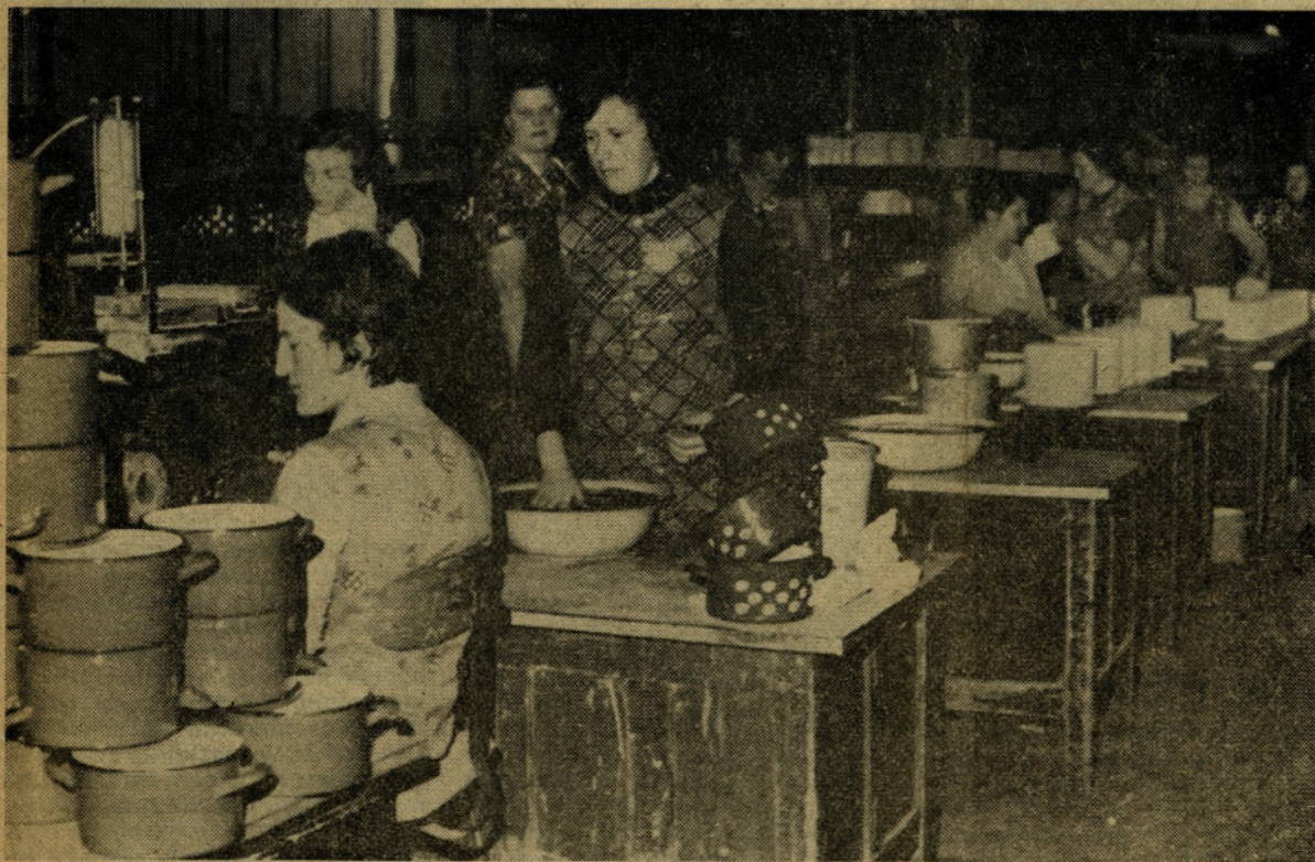
V emajlirnici je utesnjenost in poletna vročina resen problem

Pri uspešnejšem poslovanju TOZD Tovarna posode moramo upoštevati poleg prizadevanja delavcev in delavk TOZD tudi prizadevanje poslovnega odbora in vodstva podjetja. Če bo tako v bodoče, ne bomo govorili o izgubi. ej